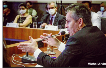
Governador Mauro Mendes durante discurso no lançamento dos programas de automatização das cobranças das taxas e de autuação, no Paiaguás