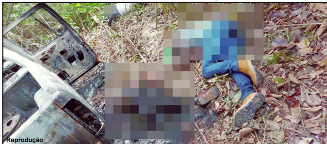
Dos quatro mortos, um foi encontrado carbonizado ao lado de S-10