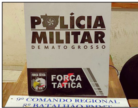
Ação policial foi da Força Tática em Alta Floresta

Um dos elementos é apontado como integrante de organização criminosa em MT