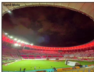
Maracanã será palco da final da Libertadores