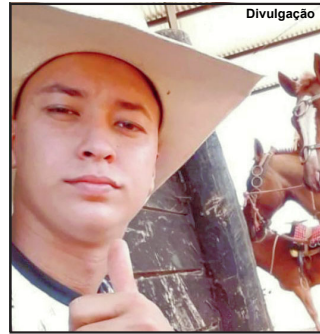
Autor de crime fugiu de Canaã