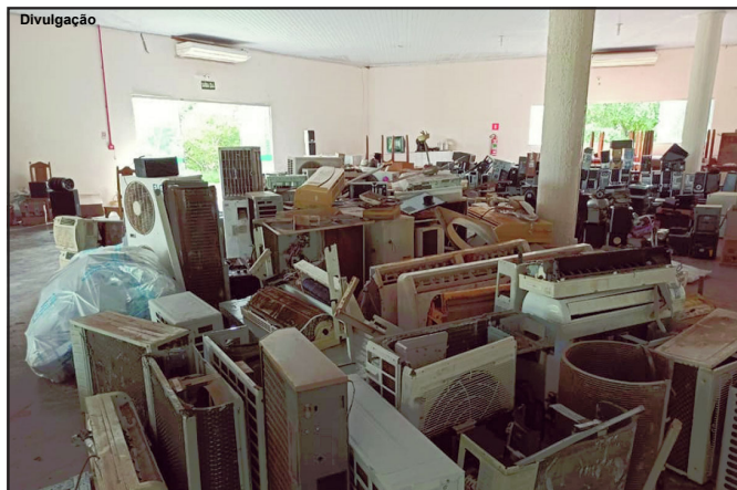
Material recebido será encaminhado para empresa de reciclagem