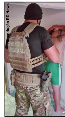
Federal investigando candidatos suspeitos

Os materiais apreendidos serão periciados e analisados pela Polícia Federal, buscando a responsabilização criminal de todos os envolvidos, com toda sua extensão e profundidade. Uma das investigadas inclusive já foi candidata ao cargo de vereadora em Nova Iguaçu (RJ) em eleições passadas. Ela foi presa em flagrante durante a execução da ordem judicial em seu desfavor por supressão de documento (art. 305 do Código Penal) por ter tentado destruir aparelho celular que já se encontrava apreendido pela Polícia Federal, prática comum entre os