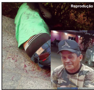
Vítima ficou internada de sexta a domingo, mas não resistiu

Parazinho segundo informações, foi espancado a pauladas. A Polícia Militar, que registrou a ocorrência, recolheu a arma do crime, um pedaço de madeira e com marcas de sangue. A vítima não soube se quer informar possível motivação, mas a Polícia Civil recebeu todas as informações da Polícia Militar e investiga o caso como homicídio doloso.