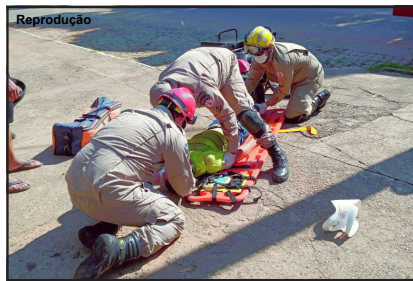
Militares agindo rápido em socorro à vítima

Bombeiros informaram que Jovem de 27 anos teve diversos ferimentos pelo corpo