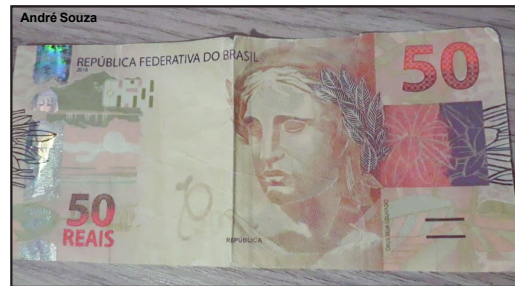
Cédula falsa foi descoberta por comerciante em AF

A Polícia Civil nos últimos meses já recebeu outras reclamações. Os casos são investigados.