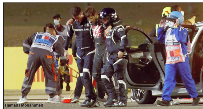
Roman Grosjean escapa de grave acidente

Em um vídeo gravado já no hospital, Grosjean mandou uma mensagem aos fãs: - Oi pessoal. Só queria dizer que estou bem, mais ou menos bem. Obrigado pelas mensagens. Eu não era fã do Halo, mas sem ele eu não conseguiria estar aqui falando com vocês hoje. Obrigado a todos os profissionais