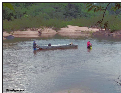
Tragédia ocorreu em fazenda domingo à tarde

O afogamento foi por volta das 14: 30 horas de domingo. Corpo de Bombeiros foi acionado e ainda naquela tarde iniciou buscas. Mas o corpo foi encontrado na manhã desta