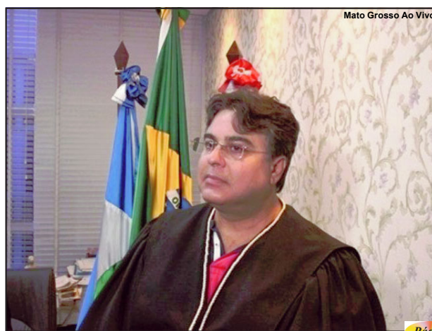
Mato Grosso Ao Vivo

A princípio o magistrado alegou razões pessoais que o levaram a tomar a decisão de se mudar do município