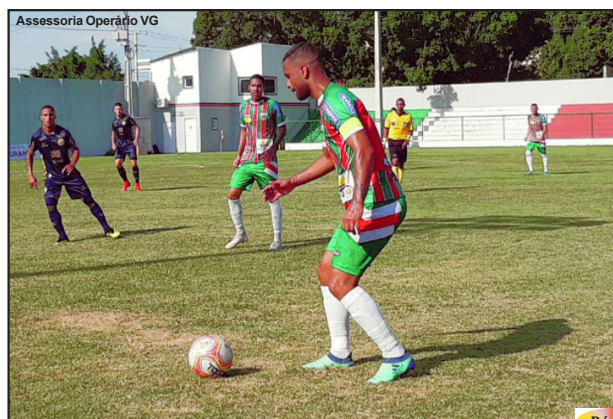
Assessoria Operário VG