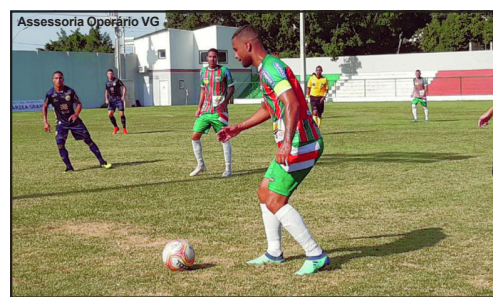
Operário foi goleado pelo Aparecidense