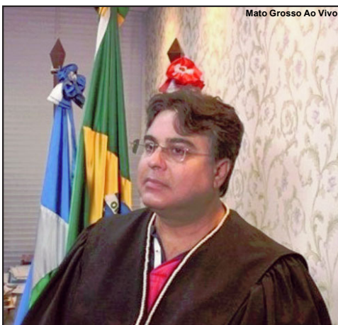
O Magistrado se despede de Alta Floresta deixando inúmeros amigos e um excelente serviço prestado em favor da sociedade altaflorestense