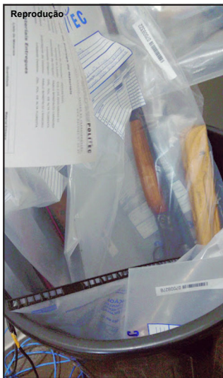
Polícia pode apurar caso de documentos em redes sociais