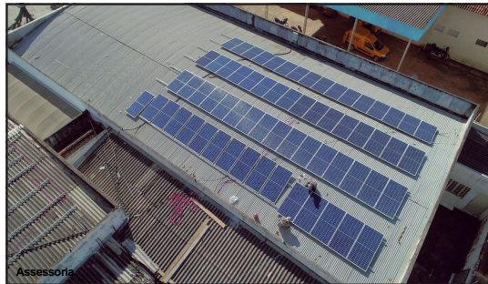
Energia solar reduz gastos na Câmara de Alta Floresta

Estudo realizado pelo Sebrae Mato Grosso estima que já no primeiro ano de operação o sistema de energia fotovoltaico representará uma redução de até 98% no valor da conta de energia elétrica do Poder Legislativo no primeiro ano. Estimativa é economizar cerca de R$ 2 milhão em 30 anos