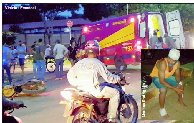
Corpo de Bombeiros logo chegou para atender a vítima em AF