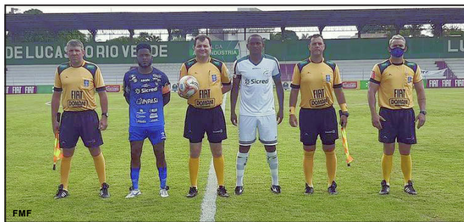
Nova Mutum está na final do estadual