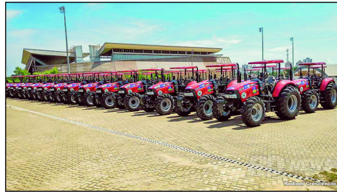
Patrulhas para serem entregues a municípios do estado de Mato Grosso