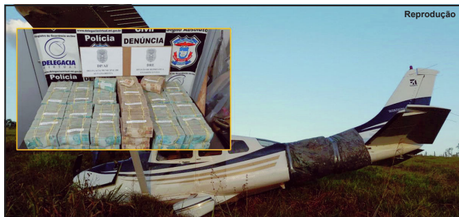
Dinheiro e aeronave foram apreendidos em 30 de junho de 2019