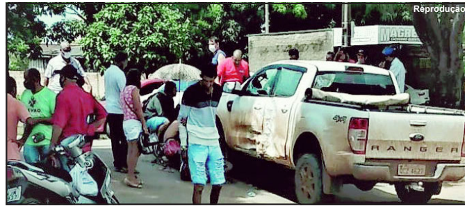
Multidão se reuniu no local do acidente domingo de manhã

transitavam na mesma direção: Avenida Amazonas ao Bairro Cidade Bela quando em frente a uma loja de motos a caminhonete foi convergir à esquerda, momento em que a motocicleta bateu de forma violenta na Ranger que ficou com a lateral totalmente danificada.