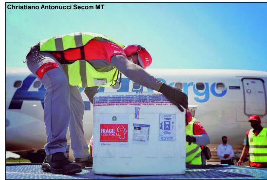
Estado recebe mais vacinas e continua imunização