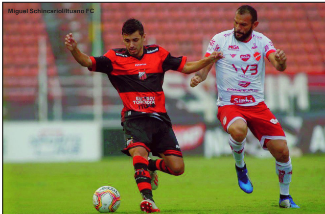
Vila Nova-GO ficou com a última vaga para a Série B