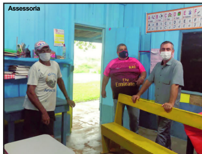
Novo prefeito com líderes comunitários