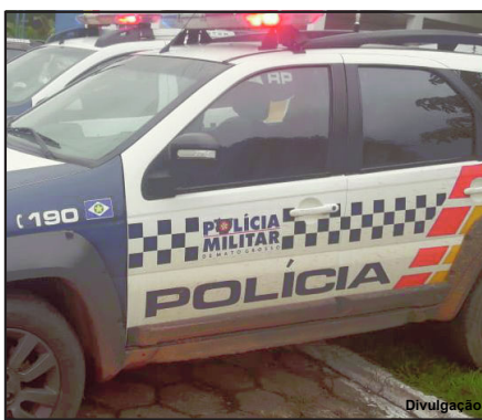
Polícia Militar foi acionada e registrou caso

Alta Floresta/MT – Uma mulher teve que correr para a casa da vizinha para não continuar sendo espancada ou ter a vida ainda mais ameaçada no final de semana no município de Alta Floresta. A vítima de 36 anos disse à Polícia Militar que o marido voltou a chegar em casa bêbado e, após lhe espancar, tentou contra sua vida com uma faca. O fato é recorrente e