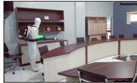
Legislativo ficará fechado ao público até dia 31