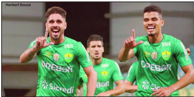
Cuiabá está próximo ao acesso para a Série A