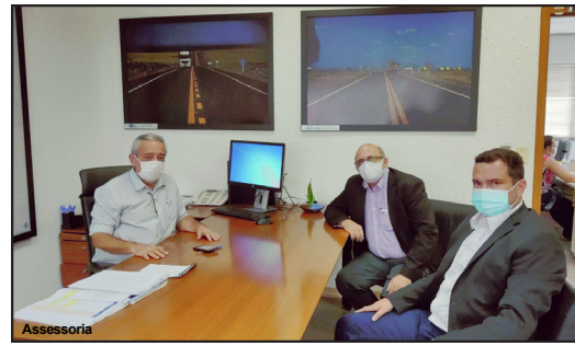
Presidente da Fiemt com líderes do estado de Mato Grosso

Empresário de Alta Floresta assumiu interinamente a presidência da Fiemt