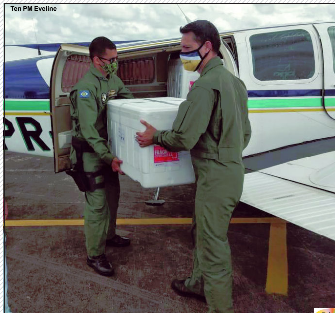
Ten PM Evelline

Doses chegaram nesta quarta-feira transportadas por um avião do estado