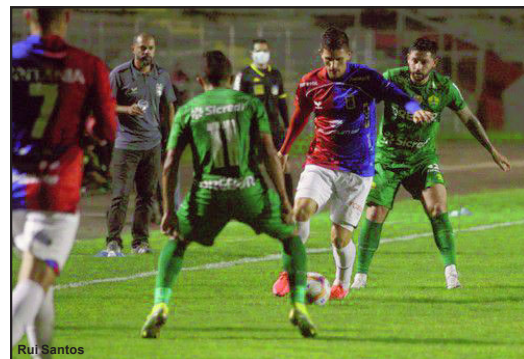
Cuiabá vence o Paraná por 2-0

Já o Cuiabá ficou na 3ª posição com 61 pontos, 5 pontos a frente do CSA, para garantir a subida para a primeira divisão nacional pela primeira vez na história, o Dourado só precisa vencer o Sampaio Corrêa na próxima rodada, se empatar e o CSA não vencer o seu compromisso, o Cuiabá também