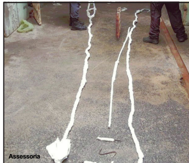
Bandidos cortaram grade para tentar fugir