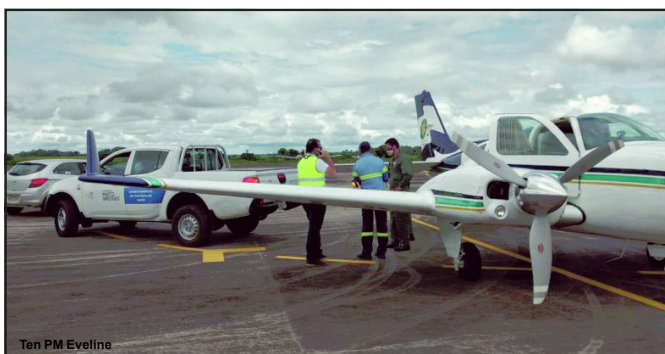
Ten PM Eveline

Doses chegaram nesta quarta-feira transportadas por um avião do estado