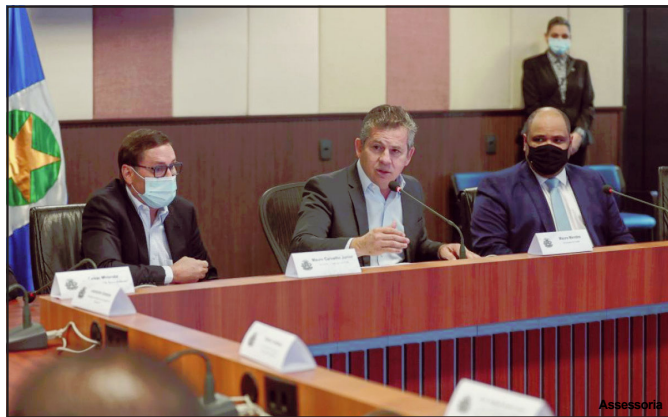
Mauro Mendes tenta articular para conseguir vacinação total da população