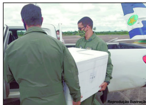
Vacina atende grupo prioritário na região de AF

Nessa nova remessa que chegou o município de Alta Floresta que na semana passada tinha ficado como mais de 620, agora ficou com 680. O restante está sendo redistribuído pelo Escritório Regional de Saúde aos municípios do