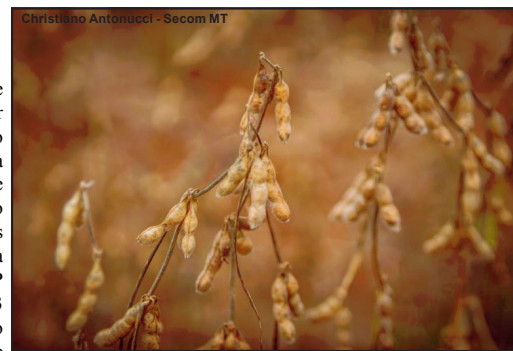
Produção de Mato Grosso é destaque nacional

De acordo com o compilado realizado pelo Observatório do Desenvolvimento, da Secretaria de Estado de Desenvolvimento Econômico (Sedec), a