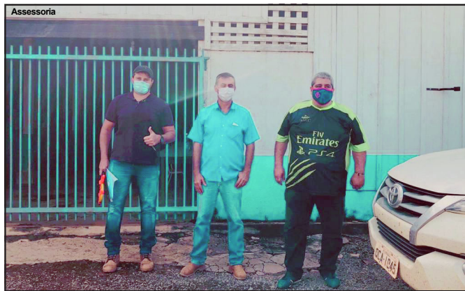
Assessoria Visita feita à unidade de ensino visa conhecer realidade mais de perto