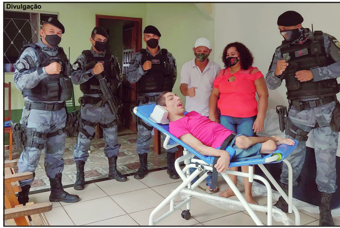
Registro dos policiais com o jovem e seus pais logo após a entrega

Aquisição do equipamento foi concretizada através de ação solidária