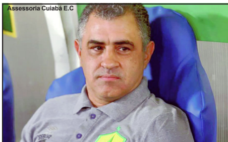
Marcelo Chamusca pode voltar ao comando do Cuiabá