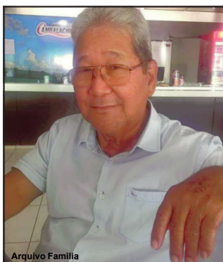
Empresário morreu em Cuiabá e foi sepultado domingo em AF

Noboro como era mais conhecido, teria sentido os sintomas do novo coronavírus ainda no dia 29 de dezembro de 2020. Na época no entanto, procurou auxílio médico, mas não chegou a ser internado. Conforme a viúva, ficou tomando remédio e seguindo outras orientações, em casa. Mas o quadro não