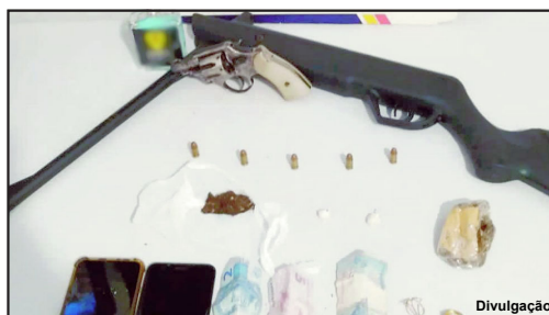
Armas e drogas apreendidas com traficante de Peixoto

A PM fechou os trabalhos nesta segunda-feira com mais uma boca fechada e mais droga apreendida. No total grande volume de maconha, pasta base, balança de precisão, dinheiro e armas foram encaminhadas à Delegacia assim como um jovem de 19 anos, outro de 24 e dois menores de 15 anos.