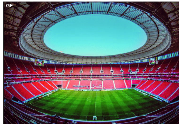
Mané Garrincha receberá segundo jogo da Recopa