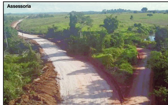
Ações da Secretaria de Obras em Apiacás

da Secretaria Municipal de Obras, realizou recentemente várias melhorias em diversas estradas rurais do município. Nessa semana um grande serviço de desvio foi executado na Estrada Santa Rosa, no qual um material