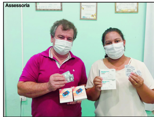
Doações serão usadas no combate à covid