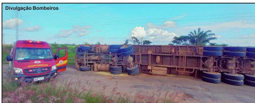
Corpo de Bombeiros atendeu duas vítimas do acidente ocorrido em AF