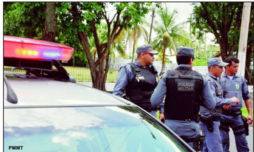
Os três envolvidos foram encaminhados para o 4º Batalhão da PM e posteriormente para a Central de Flagrantes

A Polícia Militar informa que a Corregedoria-Geral da PMMT está