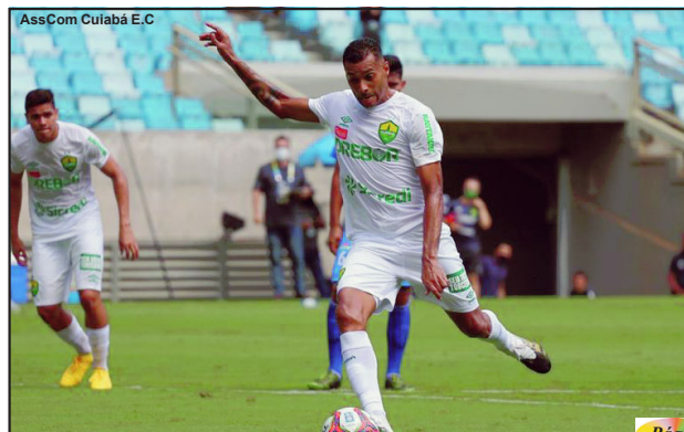
AssCom Cuiabá E.C