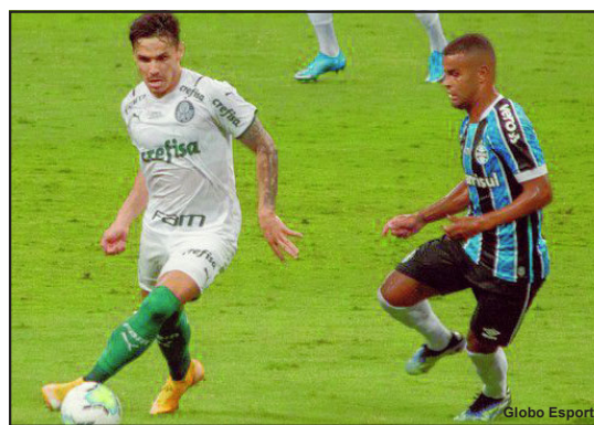
Palmeiras vence primeiro jogo da final