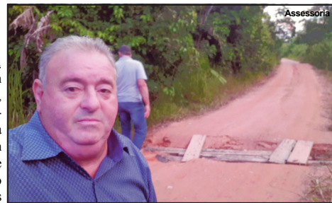
Presidente da Câmara vistoriando pontos críticos