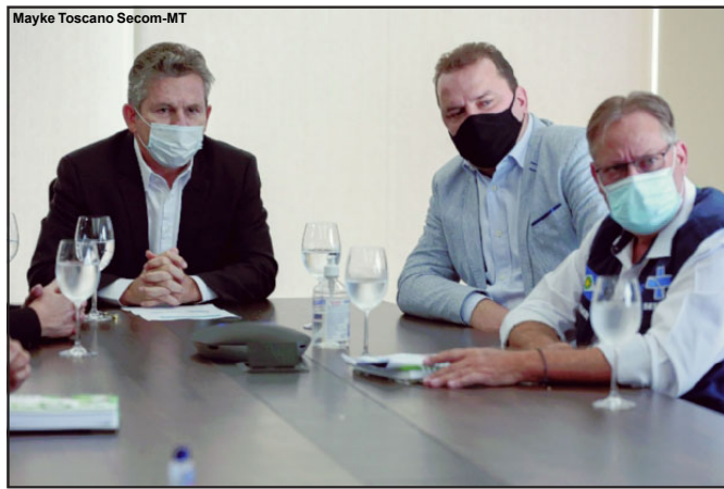
Governador assina decreto visando minimizar casos de covid-19

Olhar Direto/Ailton Marques/Do local/Max Aguiar O governador Mauro Mendes (DEM) afirma que os prefeitos não podem flexibilizar o decreto de "mini lockdown" nos 141 municípios de Mato Grosso. A decisão do Palácio Paiguás foi anunciada