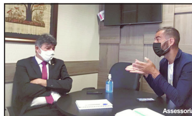
Vereador busca recursos em Cuiabá

LINDOMAR LEAL Assessoria de Imprensa Câmara Municipal