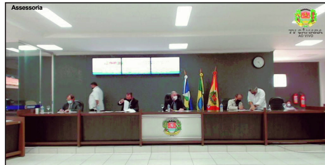
Sessões podem ser assistidas ao vivo pela TV Câmara de AF