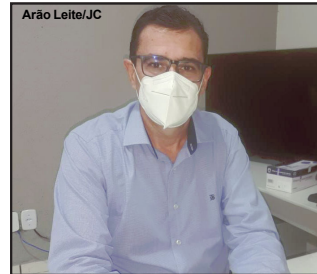
Arão Leite/JC Laureano Barella diz que o momento é crítico e preocupante

De acordo com o secretário de saúde, Laureano Barella, todas as medidas, como expediente funcionando das 5 horas da manhã somente até às 19 horas serão seguidas. As exceções são empresas como farmácias e postos de combustíveis. Esse último no caso, sem funcionamento de conveniência. O comércio noturno como bares, lanchonetes, restaurantes, choperias, academias, entre outros, só poderão atender presencial até 21 horas.