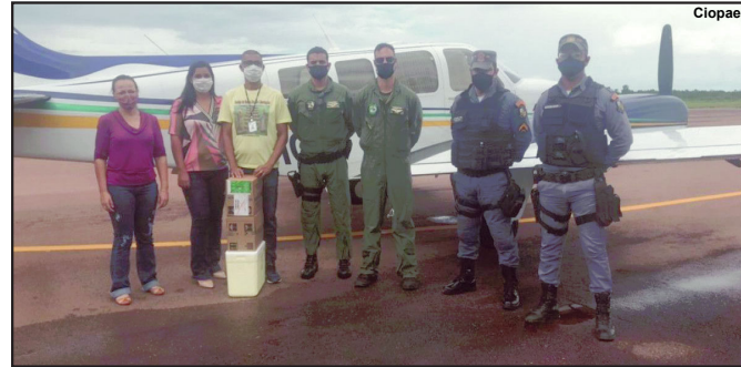
Registro feito no momento da chegada de mais lotes de vacinas à região