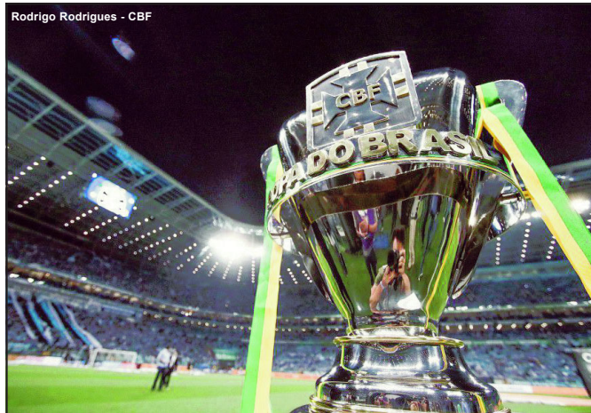
Rodrigo Rodrigues - CBF