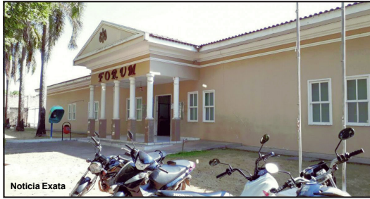
Fórum da Comarca de Alta Floresta fecha expediente

Devido ao agravamento da classificação de risco epidemiológico de 18 municípios mato-grossenses, divulgado pela Secretaria Estadual de Saúde (SES/MT), o Poder Judiciário determina a suspensão do Plano de Retorno Programado às Ati-