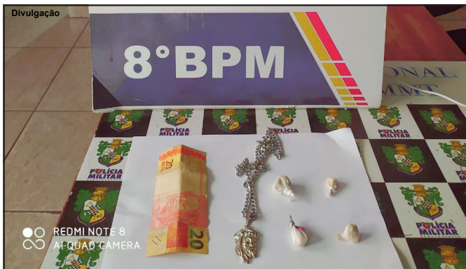
Porções de pasta base de cocaína apreendidas com suspeito

Polícia Militar segue fazendo rondas intensificadas contra traficantes