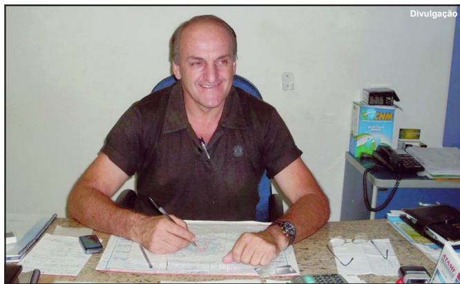
Raimundo Zanon foi mais uma figura pública a morrer de covid em MT