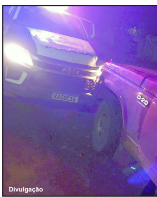
D-20 bateu de frente com carro da Pm em Nova Bandeirantes

Caminhonete de suspeito destruiu muro de paróquia e danificou viatura