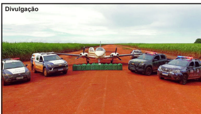
Aeronave e droga apreendidas em Cáceres