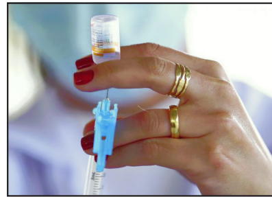
Imunizante é desenvolvido contra covid