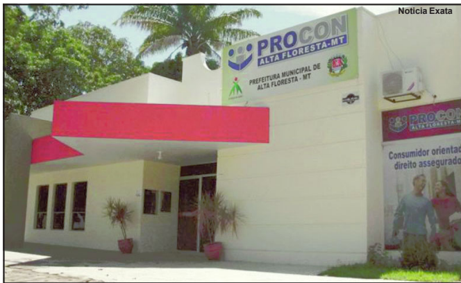
Unidade de Defesa do Consumidor em Alta Floresta