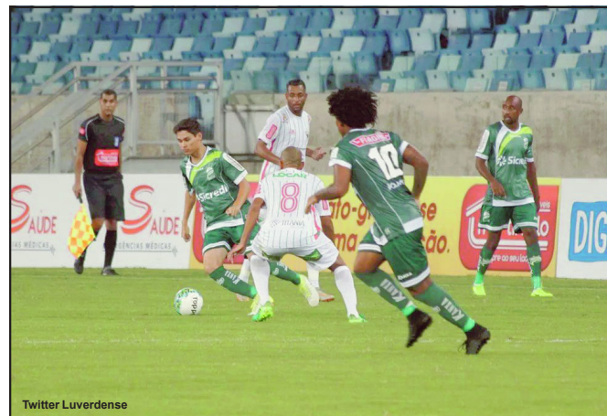
Operário venceu LEC por 2x0