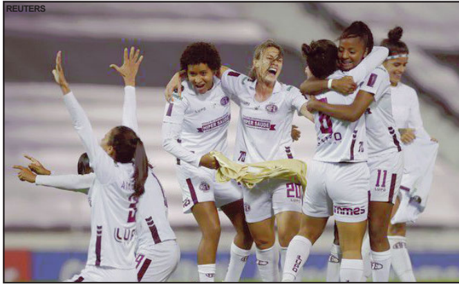
Ferroviária é bicampeã da Libertadores