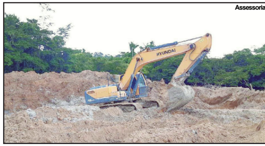
Apreensão de trator de esteira utilizado em desmatamento ilegal

Como ocorre a fiscalização Os fiscais ambientais são direcionados estrategicamente para os locais onde há desmatamento ilegal, por meio do