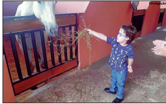
O projeto Equoterapia, visa atender alunos matriculados na APAE