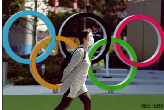
Olimpíadas vai vencer a pandemia?