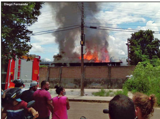
Incêndio foi registrado na tarde de domingo em Alta Floresta

Residência onde morava jovem de 26 anos e dois filhos foi transformada em escombros