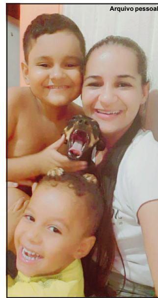
Família perdeu animal de estimação na tragédia

Mas o fogo que segundo analisaram os militares da 7ª Companhia do Corpo de Bombeiros, teria iniciado a partir do fogo do fogão em uma panela de pressão na cozinha. “Mas tenho certeza que saí de casa e não deixei nada ligado”, contesta a dona da casa, que através de amigos e parentes, iniciou uma campanha para tentar reconstruir o patrimônio. “Graças a Deus não ficamos