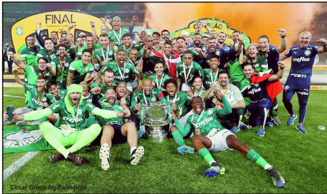
Palmeiras tetracampeão da Copa do Brasil