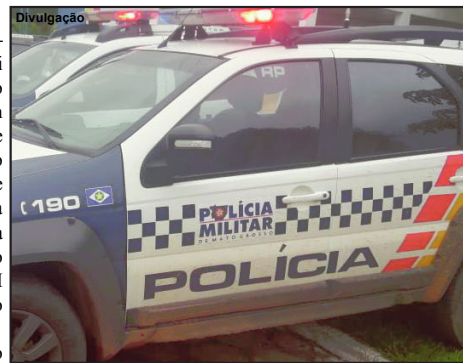
Suspeito ao ver viatura segundo a PM, fez ameaças

O oficial comentou que o jovem foi agressivo ao ser abordado e os policiais que faziam o trabalho