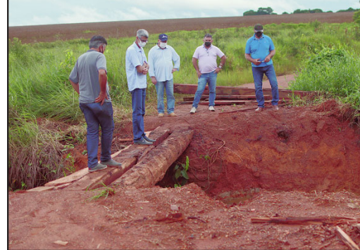
Prefeito e presidente da Câmara vistoriam pontos críticos e gestor aciona equipes de emergência