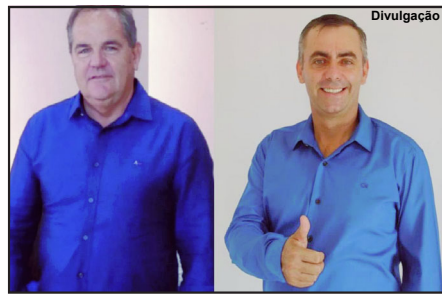
Administradores foram contaminados pela covid

De acordo com a Secretaria Municipal de Saúde, o prefeito apresentou piora no quadro de saúde no sábado (6) e permanece internado em observação.