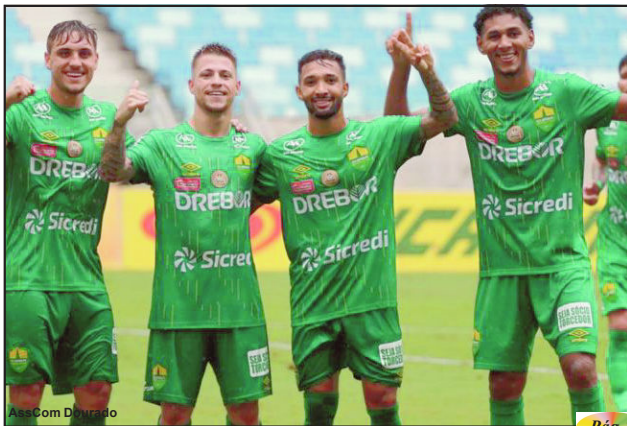
AssCom Dom Bosco

Cuiabá vence Dom Bosco no jogo de ida das quartas de final