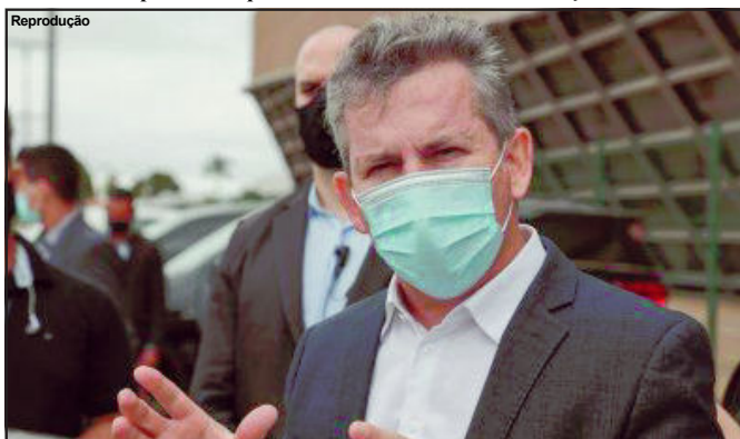
Governador tem desviado dos questionamentos sobre pleito do ano que vem