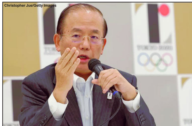
Toshiro Muto chefe-executivo Comitê Tóquio 2020

A lentidão na vacinação da população japonesa e por consequência o aumento no número de casos faz com que de 70% a 80%