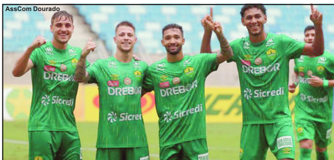
Cuiabá vence Dom Bosco