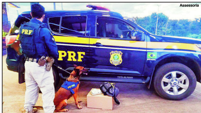
Cão farejador foi fundamental na ação policial em Cuiabá

Só Notícias A equipe do Grupo de Operações com Cães da Polícia Rodoviária Federal prendeu um homem, de 31 anos, por transportar droga num coletivo de passageiros, no quilômetro 387 da BR 364, em Cuiabá, domingo.