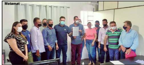
Inauguração do escritório regional da Metamat no município de Nova Bandeirantes

Empresa estadual também renovou termo de cooperação com escritório de Alta Floresta e entregou laudo de aterro sanitário ao município