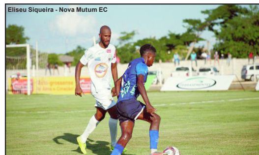
Nova Mutum e Operário ficam no 0x0