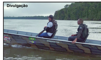
Equipe fiscalizando no Juruena