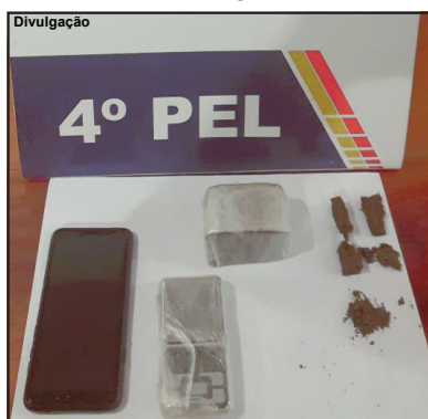
Material apreendido pela PM em Paranaíta

Homem ainda tentou fugir, mas acabou preso e segundo a PM, confessou o tráfico