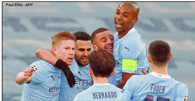
M.City está na final da Champions