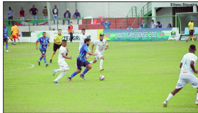
Operário superou Nova Mutum na semifinal