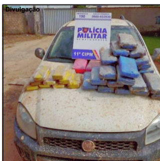
Droga e carro foram apreendidos

PM foi chamada para verificar uma atitude suspeita de um homem na BR 174, ele estava com um corte na cabeça e entrou na mata o que chamou atenção de testemunhas.