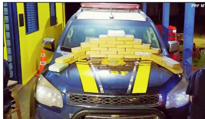
Droga apreendida pela Polícia Rodoviária Federal