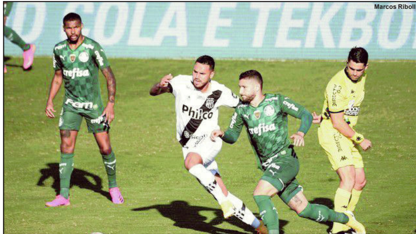
Palmeiras vence a Ponte Preta por 3x0