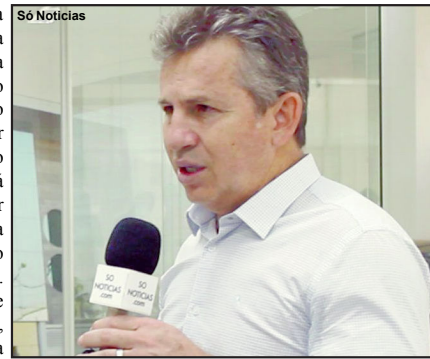
Mauro Mendes chega em AF quinta final da tarde

Essa será a primeira visita do governador Mauro Mendes ao município de Alta Floresta desde que venceu as eleições no ano de 2018. Possivelmente candidato à reeleição, Mendes busca também estender sua popularidade pelo estado e uma forma é participando pessoalmente de lançamento de obras,