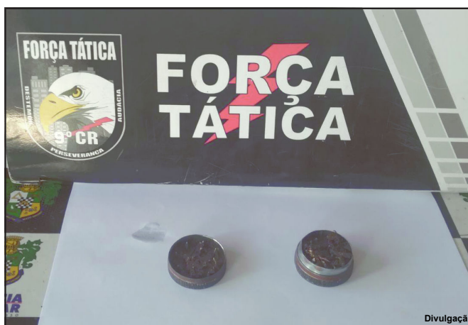
Dichavador e droga foram encaminhados à Delegacia