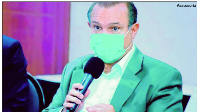
Wellington Fagundes é um dos senadores da República representando MT