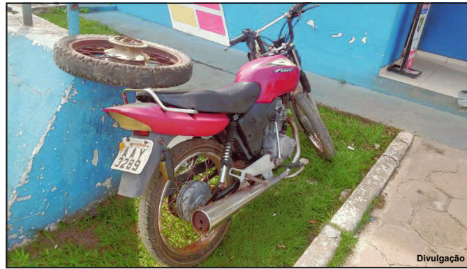
Motocicleta foi encontrada nesta segunda-feira, dia 17 de maio

O autor do furto é um adolescente de 17 anos e envolvido em várias outras infrações, mas no momento da ação policial para resgatar a moto, desapareceu nesta segunda-feira. Horas antes no entanto, quando um irmão foi até a Secretaria em busca de informações