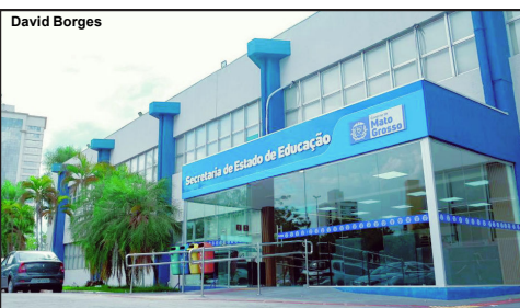
Na sede da Seduc-MT, em Cuiabá, o retorno 100% presencial dos servidores já ocorreu no início de maio com jornada das 8h às 18h

O Governo de Mato Grosso, por meio da Secretaria de Estado de Educação (Seduc-MT), determinou o retorno dos professores ao trabalho presencial. Permanecem em teletrabalho apenas os profissionais considerados dos grupos de risco ao novo coronavírus. A nova portaria, no entanto, não determina o retorno das aulas presenciais.