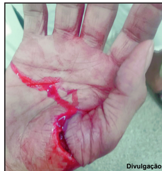
Mão da vítima teve corte profundo

Caso foi registrado no domingo e suspeito de 45 anos está preso