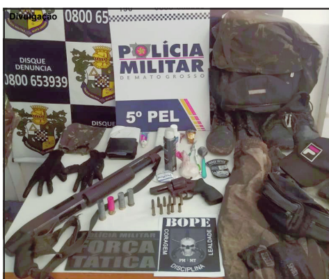
Arma de bandidos mortos em Bandeirantes

Força Tática de Alta Floresta teria sido recebida a tiros e revidou contra elementos