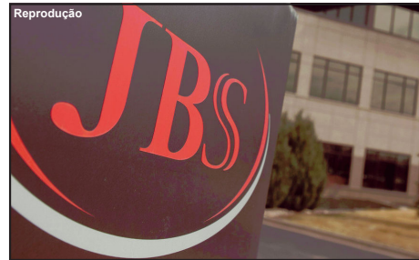
A empresa JBS é uma das maiores do ramo alimentício do mundo

“É que nestas hipóteses, ainda que o animal esteja sendo manipulado por empregado experiente, cabe ao seu dono (o empregador) responder por sua reação