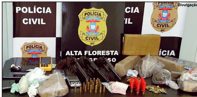
Armas, maconha, cocaína e farta munição apreendidas em operação da PC

Decisão foi tomada ainda na sexta-feira, 18, pelo Juiz Dante Rodrigo Aranha da Silva, da 5ª Vara de Alta Floresta