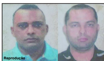
Elementos são do Pernambuco

Eles foram mortos em confronto em uma área a cerca de 10 quilômetros de Nova Bandeirantes sentido Nova Monte Verde. Foi durante a madrugada desta segunda-feira, dia 21 que policiais militares viram de três a quatro elementos saindo da mata, mas quando