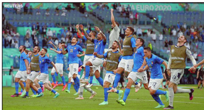
Itália está em grande fase