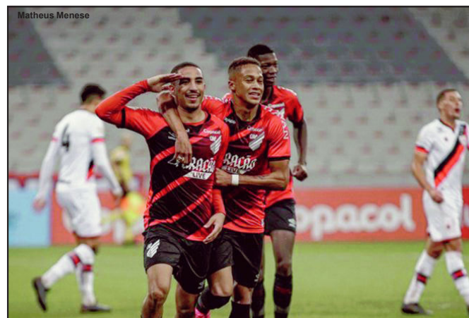
Furacão é o novo líder do Brasileirão

Flamengo 2x3 RB Bragantino Palmeiras 2x1 América Mineiro Internacional 1x1 Ceará Bahia 0x0 Corinthians Santos 2x0 São Paulo Fortaleza 1x1 Fluminense Athletico PR 2x1 Atlético GO Juventude 1x0 Sport