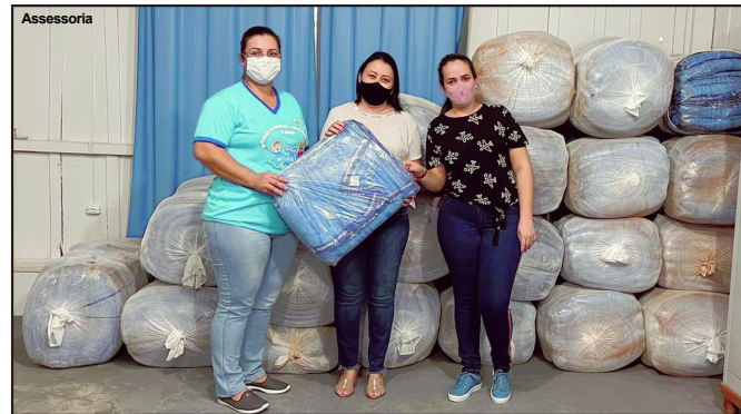
Itens devem atender a comunidade carente