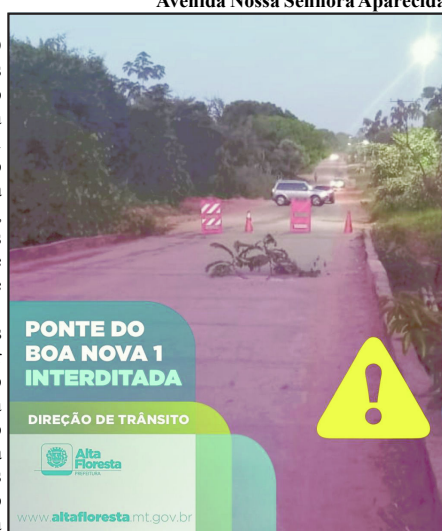
Interdição comunicada pela Direção de Trânsito

A obra já tem tempo e os moradores cobram há mais de dois anos também, a substituição das toras e vigamentos da ponte que sempre vibra com quando os