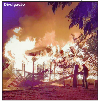
Flutuante queimou totalmente em menos de meia hora

Uma construção de 200 metros quadrados, com quatro quartos, salão, cozinha, restaurante e uma história de vida de mais de 20 anos que virou tudo escombros. “Não sobrou nada, só essa roupa do