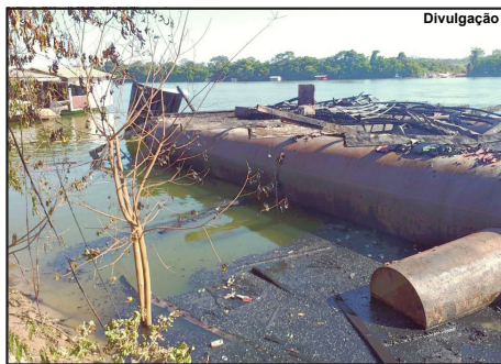
Além da tubulação, só restaram escombros da flutuante

Por Arão Leite Alta Floresta/MT – Início da noite de terça-feira e de repente muita fumaça, fogo, explosões. Foi assim que tudo começou na Flutuante Bisteca, do ribeirão João Bisteca e sua família para acolher os pescadores do município, mas que acabou destruída em menos de 30 minutos por um incêndio