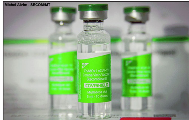
Para a vacina AstraZeneca, o prazo de aplicação da segunda dose é de até 90 dias

Até o momento, Mato Grosso já recebeu 1.684.920 doses de imunizantes contra a Covid-19