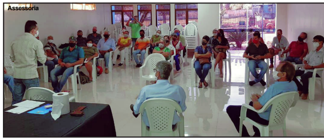
Reunião de vereadores e prefeito com os feirantes de Alta Floresta

LINDOMAR LEAL Assessoria de Imprensa Câmara Municipal