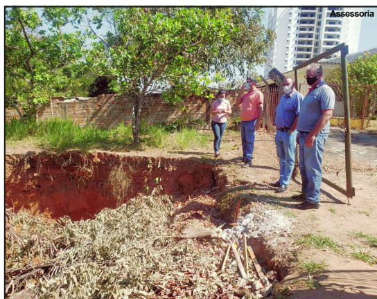
Equipe estuda questão para escoamento da água da chuva