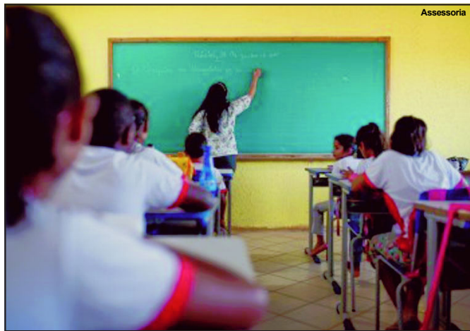
Situação de muitas unidades de ensino do estado é precária