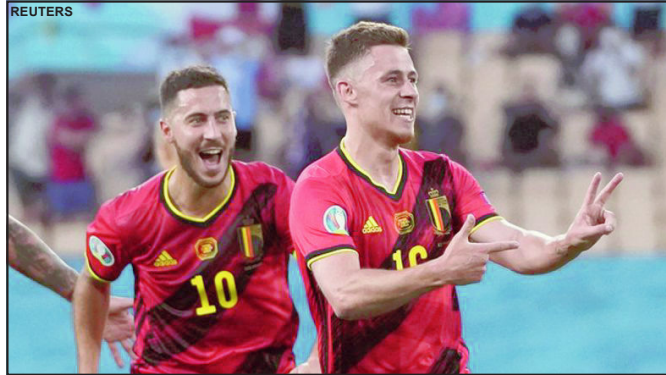
Thorgan Hazard comemora gol ao lado do irmão Éden Hazard