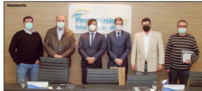
Visita à sede da Federação do Comércio em Mato Grosso