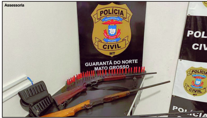
Armas foram apreendidas pela Polícia Civil em fazenda