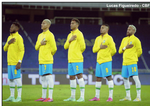
Seleção do Brasil vai em busca da décima Copa América

Peru x Paraguai Sex 02/07 – Olimpico (GO) 17:00h