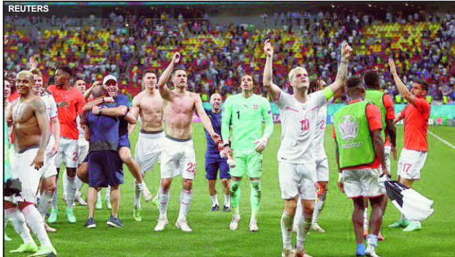
Suíça comemora classificação diante da França