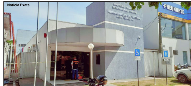
Promotoria de Justiça da Comarca de Alta Floresta

inicialmente pela Resolução nº 181/2017 do Conselho Nacional do Ministério Público (CNMP) e depois consagrada no art. 28-A do Código de Processo Penal (CPP), por meio