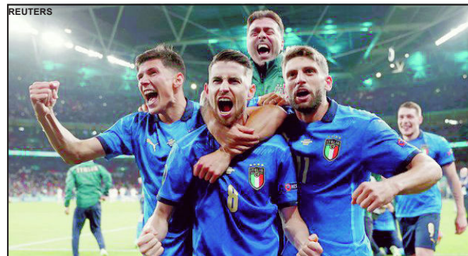
Itália enfrenta a Inglaterra na final da Euro

A Espanha teve a bola, dominou as ações durante a maior parte do jogo, no total foram 65% de posse de bola e 16 finalizações, a Itália teve apenas 7 chutes ao gol. A diferença é que a Itália de Roberto Mancini não só se defende bem como ataca muito bem. O segundo tempo foi aberto, chances para os dois lados e após boa trama que começou nos pés do goleiro Donnaruma e terminou com a finalização de Chiesa a Azurra abriu o placar. Na reta final do jogo o atacante Morata tabelou com Olmo e empatou. Com nova igualdade