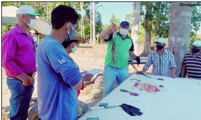
Curso tem como foco reforçar a qualidade da agricultura familiar

Realização foi da Secretaria de Agricultura, SENAR e Sindicato Rural