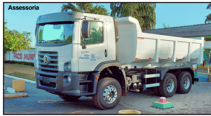
Caminhão vai compor frota do município