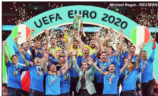
Itália é bicampeã da Eurocopa

O futebol está indo para Roma! A Itália venceu a Inglaterra em Wembley pela final da Euro 2020 e conquistou seu segundo título na