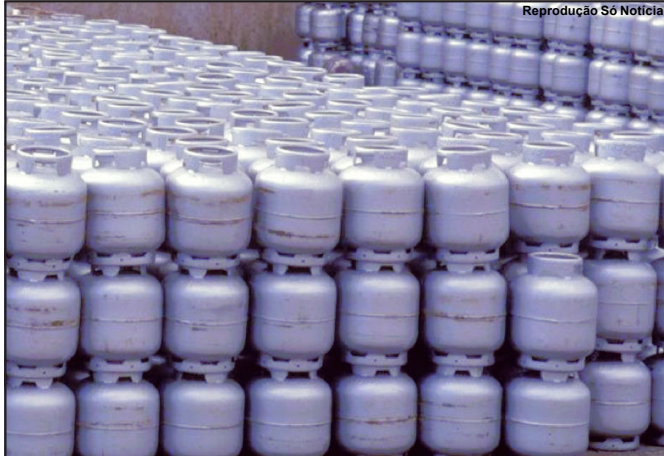
Preço do gás aumenta e consumidores ficam preocupados no estado

Só Notícias/Herbert de Souza O preço médio do gás de cozinha (GLP) subiu 13,5% em um ano em Mato Grosso, de acordo com dados da Agência Nacional de Petróleo (ANP). Com base nos levantamentos divulgados semanalmente pela autarquia, Só Notícias que o preço médio do botijão passou de R$ 96, em julho do ano passado, para R$ 109, no início deste mês.