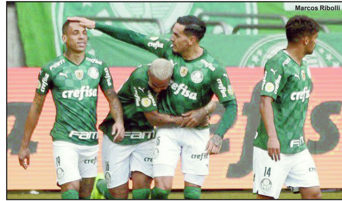
Palmeiras vence o Santos em clássico