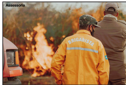
Brigadistas serão contratados em AF