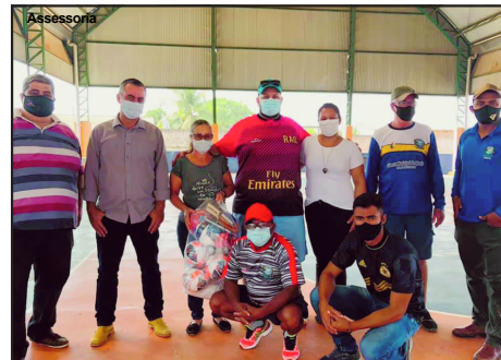
Prefeito e Staff do esporte registrando o momento