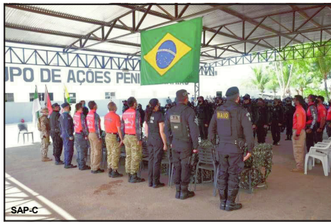
Curso de Intervenção Rápida em Recinto Carcerário

Para participar do curso, os agentes precisaram obter êxito no Teste de Aptidão