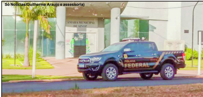
Representante do legislativo sinopense foi apenas um dos presos pela PF