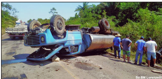
Sd BM Lorenzetti

Acidente mobilizou três viaturas do Corpo de Bombeiros de Alta Floresta