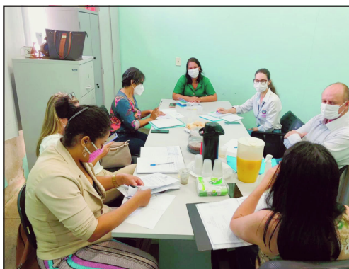
Reunião realizada na cidade de Apicás

Encontro discutiu propostas para elaboração do Plano de Ação do Programa