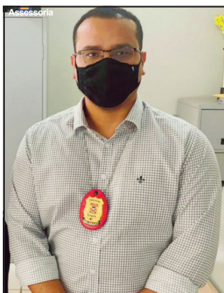
Delegado do caso (foto) explica condução de um servidor

Contato com a prefeitura de Alta Floresta teria sido firmado entre 2020 e 2021