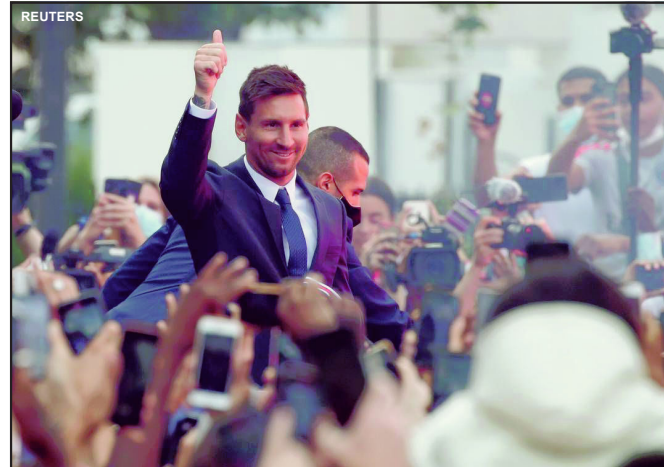
Messi é jogador do PSG