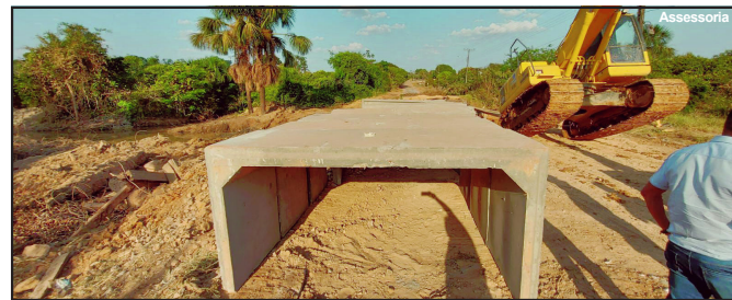
Obra de aduelas em andamento na Avenida Nossa Senhora Aparecida

LINDOMARLEAL Assessoria de Imprensa Câmara Municipal