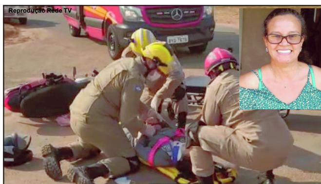
A trabalhadora sofreu vários ferimentos, fez duas cirurgias, mas morreu

O motorista do carro também foi conduzido por dirigir sob influência de álcool.