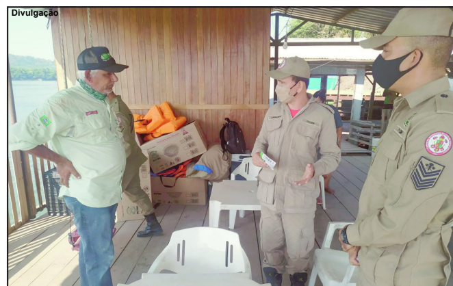
Corpo de Bombeiros de Alta Floresta é solidário com ribeirinho que perdeu casa em incêndio