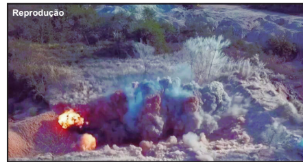
Momento que explosivos foram detonados