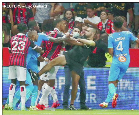
Confusão generalizada no jogo entre Nice x Olympique