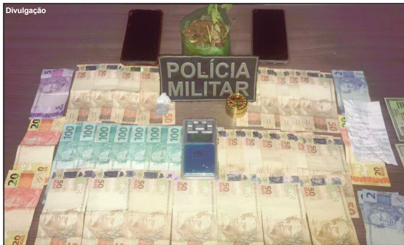
Dinheiro e balança de precisão foram apreendidos na operação