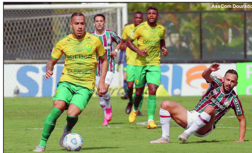
Cuiabá recebe o Fluminense na Arena Pantanal