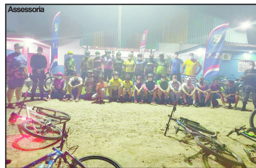
Ação organizada pelo Departamento de Esportes no município de Apiacás