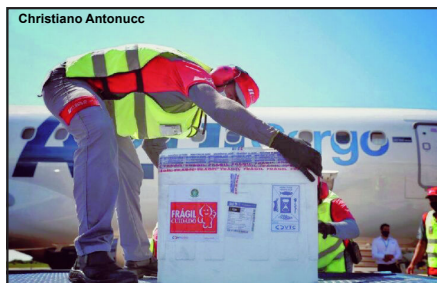
Imunizante chega para vacinar mais gente no estado