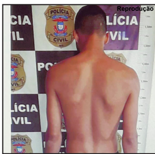
Suspeito de 22 anos, de Rondonia, está atrás das grades em AF

Alta Floresta/MT – A apreensão de 30 tabletes de pasta base de cocaína na cidade de Nova Monte Verde na semana passada rendeu um prejuízo de mais ou menos quatro milhões