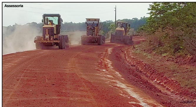
Assessoria MT-325 sendo recuperada pela Prefeitura de Alta Floresta

LINDOMAR LEAL Assessoria de Imprensa Câmara Municipal