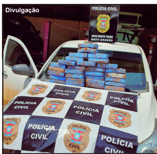
Entorpecente estava escondido em compartimento camuflado

Delegado diz que é resultado de uma ação conjunta entre as cidades e apoio da PF