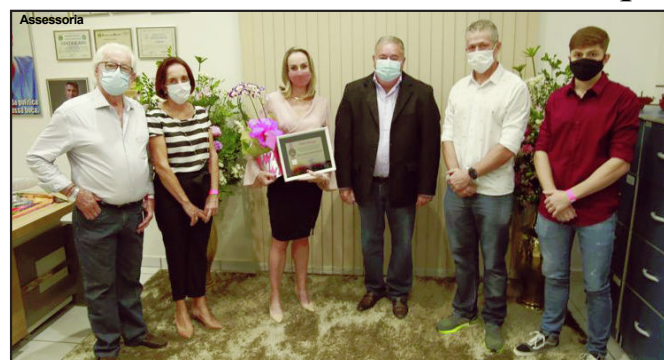
Vereador presidente com a empresária homenageada e seus familiares

LINDOMARLEAL Assessoria de Imprensa Câmara Municipal