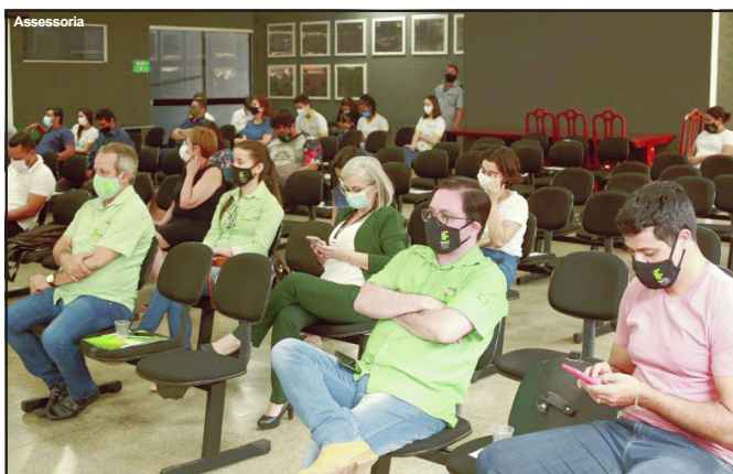
Professores e alunos acompanharam votação da matéria em AF

Proposta foi aprovada nesta quarta-feira e agora resta sanção do Executivo