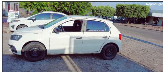
Carro foi recuperado no bairro Jardim das Flores

Vítima relata detalhes do momento em que os ladrões lhe ameaçavam de morte