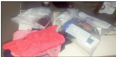
Produtos recuperados pela Polícia Civil

Divisão de roubos e furtos não descarta que suspeito já faz parte de facção