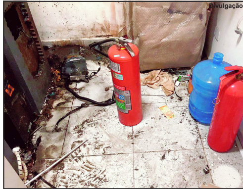
Cilindros de oxigênio usados para arrombar caixa

Alta Floresta/MT – Depois de pouco mais de três meses do assalto no modelo Novo Cangaço, a cidade de Nova Bandeirantes volta a ter um banco invadido por bandidos. Foi na madrugada de quinta-feira, depois de um temporal, falta de energia e que não tinha praticamente ninguém na rua quando o bando, usando ferramentas, cilindros de oxigênio e outros equipamentos arrombaram a agência Bradesco de onde levaram certa quantia em dinheiro.