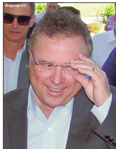
Blairo Maggi usou redes sociais para falar do assunto essa semana

Blairo não escondeu que o ambiente é de preocupação e ainda espera que o presidente mantenha o tom mais ameno e evite o agravamento da crise iniciada após suas falas nas manifestações de 7 de setembro