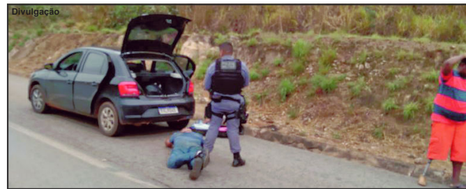
Suspeitos foram interceptados e presos na BR 163 pela Polícia Militar

No mesmo dia três suspeitos foram presos. Com eles, parte do dinheiro foi recuperado. Agora, a Polícia Civil deve continuar investigando o caso.