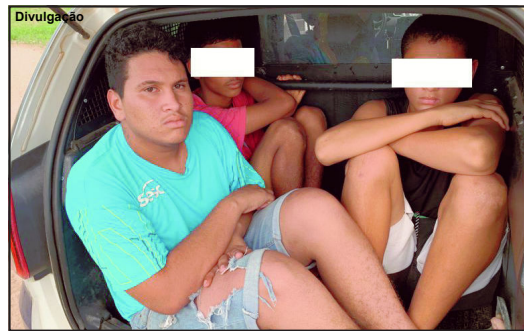
Menores e esse jovem roubaram dois carros de aplicativo e em um veículo eles atearam fogo

O trabalhador que recebeu chamado para fazer uma corrida, foi na sexta-feira início da tarde até o bairro Bom Pastor. Mas chegando lá os elementos o renderam, o levaram para um local ermo, o amarraram e o deixaram dentro do moto. Os gritos de socorro ouvidos por algumas testemunhas ajudaram o homem a se soltar. No mesmo momento a PM saiu em diligência em busca de identificar possíveis suspeitos.