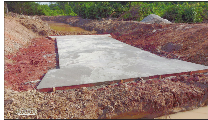
Obra em execução na zona rural de Alta Floresta

Galeria está sendo construída no lugar de uma ponte de madeira que foi queimada por vândalos no início deste mês. Base de concreto armado ficou pronta esta semana e deve receber aduelas nos próximos dias