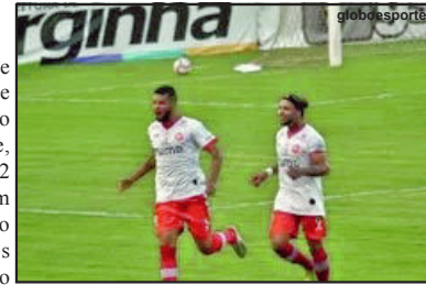
União Rondonópolis está nas oitavas de final da Série D

O Nova Mutum conquistou grande resultado fora de casa ao empatar por 1x1 e tinha vantagem do empate, mas o Uberlândia venceu por 0x2 com gols