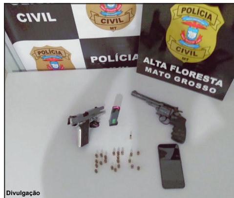
Pistola e Revólver eram usados para cobranças e extorsões, conforme denúncia das vítimas

Uma das armas apreendidas tem o documento vencido e a outra estava sem registro. Além disso, o investigador Paulo Magno informou que o revólver apareceu nos registros da Polícia Civil como sendo produto de roubo ou furto. “Continuamos investigando cada caso”, finalizou.