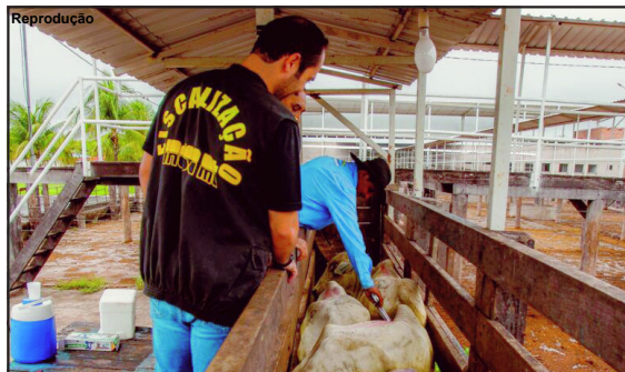
Estado sempre foi destaque em rebanho vacinado