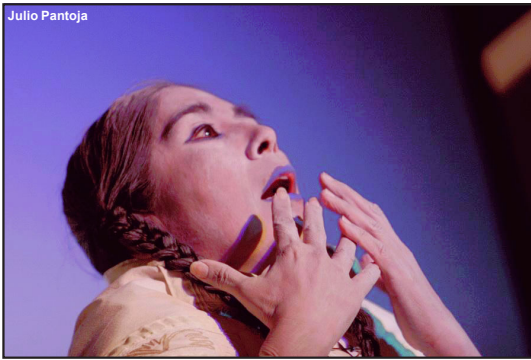
Grupo cultural peruano Yuyachkani

O evento terá uma Mostra Virtual com transmissão de espetáculos ao vivo e gra-