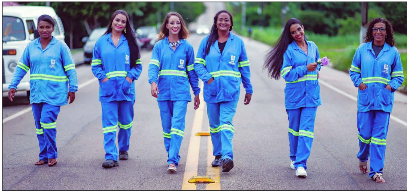
Um grupo de mulheres muito importantes para o município de AF. Elas são da equipe da zeladoria, da limpeza de rua, mas aqui são homenageadas. parabéns