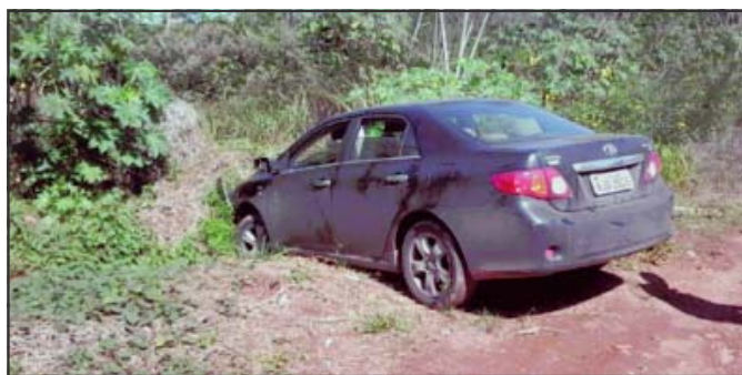
Veículo Corolla apreendido em Lucas do Rio Verde é clonado