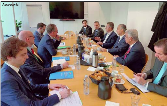
Governador Mauro Mendes em reunião com vice-ministro da Dinamarca

Governador de Mato Grosso convidou equipe do Ministério da Agricultura do país europeu para conhecer o Estado e estreitar relações