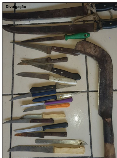
Além da foice, outras armas encontradas na casa do suspeito

Transferência do preso que estava em cela provisória na Delegacia foi na segunda-feira