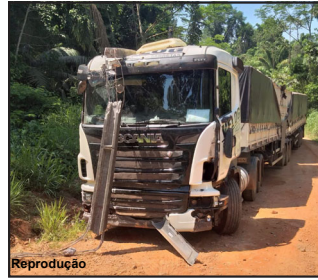
Caminhão foi recuperado em Alta Floresta

Caso foi registrado junto à Delegacia que designou Divisão de Roubos e Furtos para apuração