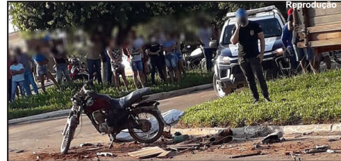
Motoqueiro teria invadido a preferencial quando bateu violentamente