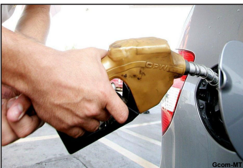
Após aprovação do texto pela Assembleia Legislativa, Mato Grosso passará a ter a menor alíquota de ICMS sobre a gasolina no Brasil

O preço médio do litro da gasolina comercializada em Mato Grosso sofrerá uma redução de até R$ 0,16, conforme projeção da Secretaria de Fazenda (Sefaz-MT), a partir de janeiro de 2022, quando deve entrar em vigor o Projeto de Lei do Governo do Estado