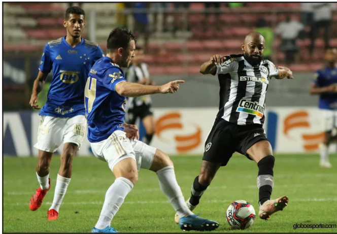
Cruzeiro e Botafogo no Independência