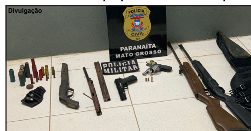
Revólver foi apreendido junto a arsenal exibido por suspeito em vídeo na cidade de Paranaíta

Revólver calibre 38 era exibido em rede social por dupla que foi identificada e um preso