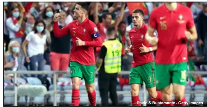
Cristiano Ronaldo fez três gols diante de Luxemburgo