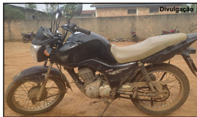
Motocicleta tinha sido furtada

Polícia Militar recuperou veículo e proprietário comunicou o furto