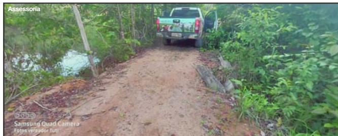
Recuperação garante melhoria de vicinal em Alta Floresta

LINDOMARLEAL Assessoria de Imprensa Câmara Municipal