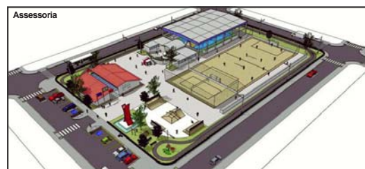
Empreendimento avaliado em R$ 3,6 milhões