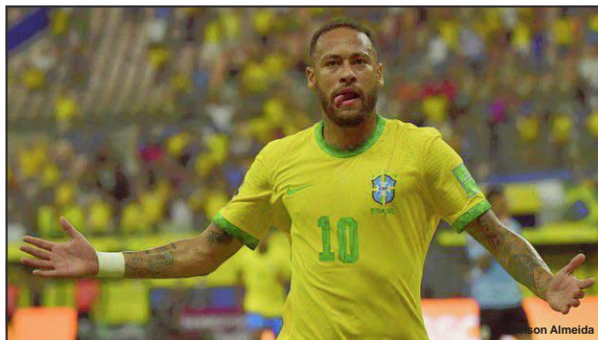
Neymar comemora gol diante do Uruguai