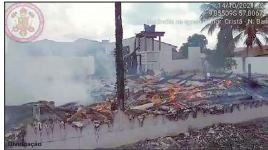
Estrutura onde funcionava Igreja Cristá, foi transformada em escombros

Estrutura de madeira foi consumida em poucos minutos pelas chamas