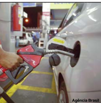
O preço do combustível tem aumentado de forma frequente

Em Mato Grosso, a alíquota de ICMS na venda interna de gasolina e etanol é de 25% e de diesel 17%. Para tornar o etanol produzido pelas indústrias locais competitivo em relação a outros estados,