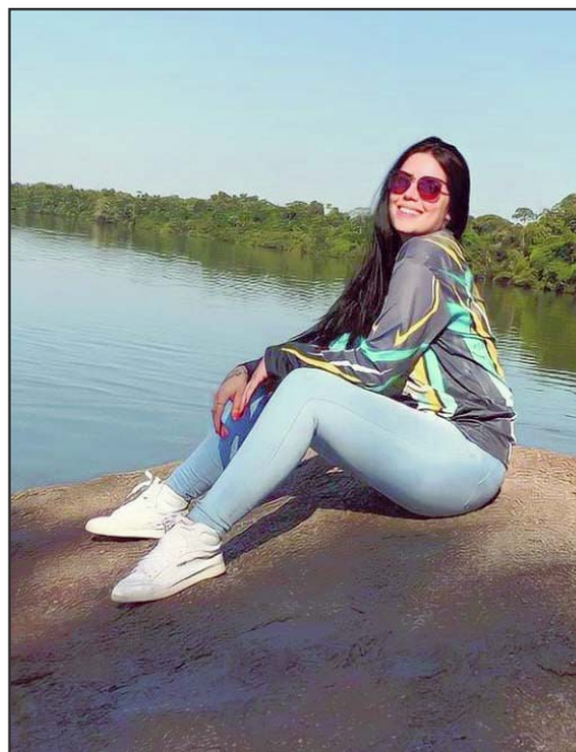
Um momento de paz. Palavras de Wellen