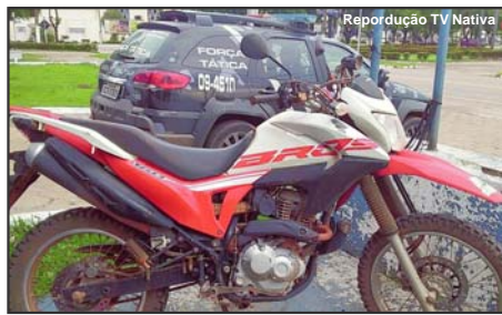
Polícia Militar foi comunicada da moto abandonada em bairro periférico de Alta Floresta