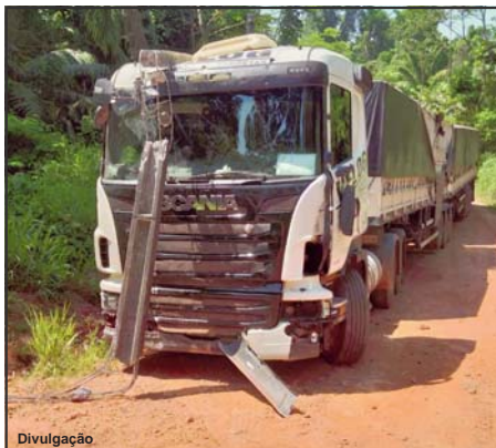
Caminhão foi periciado pela Polítec

Homem de 56 anos prestou queixa de um roubo que não aconteceu