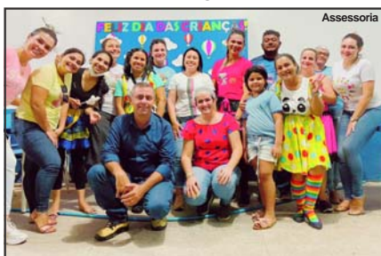
Evento realizado na cidade de Apiaçás