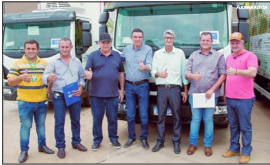
Momento da entrega do caminhão em Alta Floresta