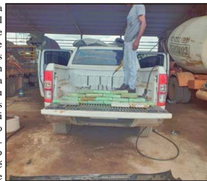
Droga foi descoberta em compartimento da caminhonete

Em depoimento, o motorista teria dado a versão de que foi contratado para dirigir a caminhonete até Alta Floresta onde deixaria o veículo em um posto de combustível e depois outra pessoa “que ele disse não conhecer, seguiria com a Ranger que foi adquirida em Sinop”, completou o delegado lembrando que esse tipo de versão é muito usada por suspeitos quando flagrados com droga e