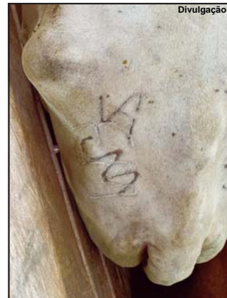
Ladrões tentaram trocar marca dos animais

Na época o pecuarista procurou a Delegacia de Alta Floresta para registra a queixa do sumiço do gado, mas ali iniciava uma apuração por parte da família, paralela ao trabalho da polícia. Foi então que dia 31 de outubro e dia 1º de novembro foi descoberto que os animais estavam na propriedade rural do funcionário da fazenda vizinha de onde tinha ocorrido o desaparecimento. “Ele e o irmão dele tiraram o gado num