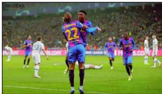
Fati comemora gol da vitória