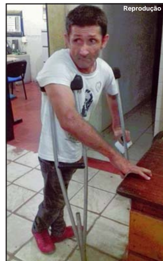
Lincom foi vítima de assassinato e o corpo encontrado em AF

Homem tinha 55 anos e foi alvo de vários golpes de arma branca