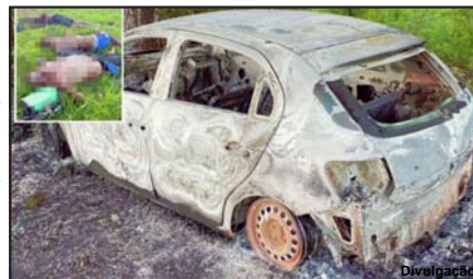
Vítimas foram executadas com diversos tiros na cabeça e um veículo incendiado

localizaram um veículo Gol branco carbonizado.