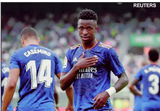
Vini Jr comemora gol frente ao Elche

Quis o destino que Firmino saísse lesionado do último confronto do