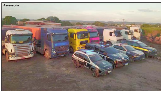
Assessoria Secretaria de fazenda em Mato Grosso faz cerco aos sonegadores

Operação teve apoio Batalhão Fazendário e das Polícias Rodoviária e Civil