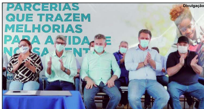
Senador de Mato Grosso tem destinado recursos para cidades do interior