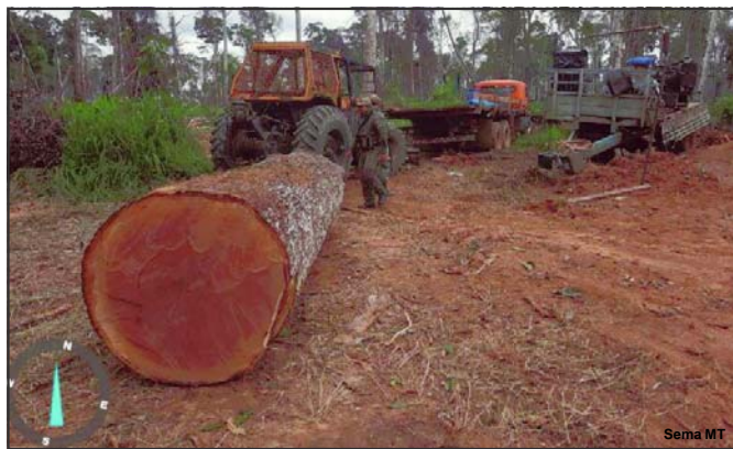
Máquinas e madeiras foram apreendidas pela fiscalização