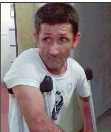
Lincom tinha 55 anos

De bermuda e com uma camiseta, o homem não foi reconhecido naquele momento, mas início da semana uma sobrinha teria comparecido ao IML para reconhecimento. Mesmo assim a Perícia ainda aguardava até esta sexta-feira