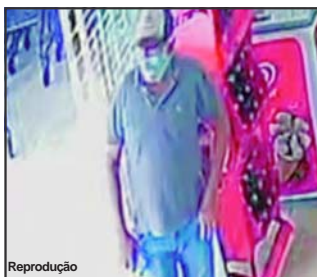
Reprodução Câmera registrou quando gossista passou pelo município de Carlinda

Câmeras de segurança registraram o momento em que o elemento tentava aplicar mais um golpe. “Ele