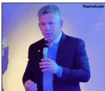
O governador Mauro Mendes durante participação em evento na Escócia

ambiental. Os países ricos precisam reduzir emissões de carbono na queima de combustíveis fósseis”, ressaltou.