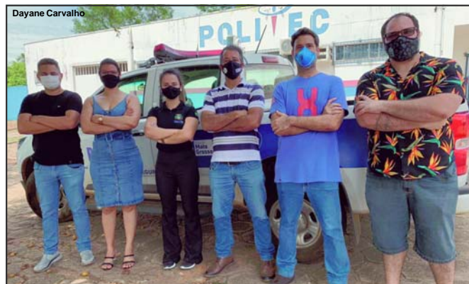
Foram convocados dois técnicos em necropsia e três papiloscopistas para AF

Dois técnicos em Necropsia e três papiloscopistas vão integrar equipe