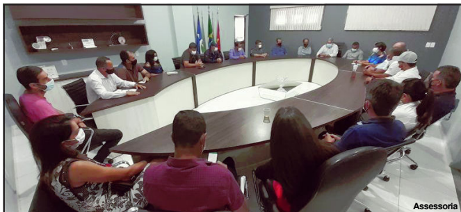
Donos de empresas pedem apoio à Câmara de Vereadores em AF

LINDOMAR LEAL Assessoria de Imprensa Câmara Municipal