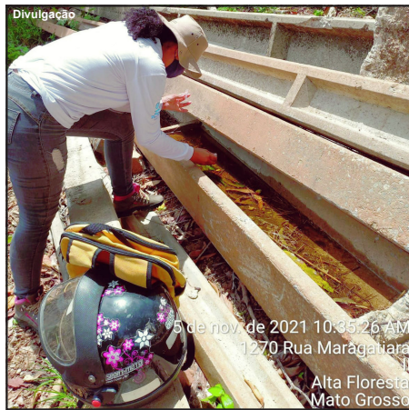
Criadouros do mosquito da dengue têm sido encontrados com frequência

Assessor de vigilância ambiental orienta para que população tenha o máximo de cuidado