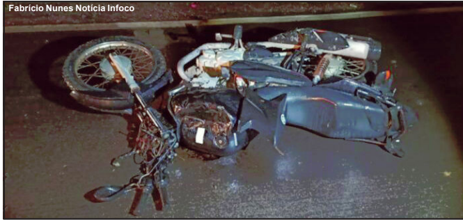
Motocicleta onde estavam as vítimas da tragédia no final de semana