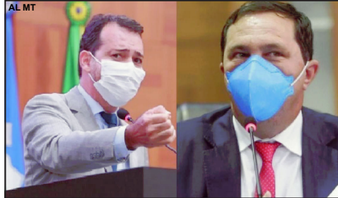
Parlamentares tentam barrar processo de licitação