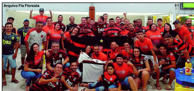
Torcedores do Flamengo em Alta Floresta querem assistir final juntos

Sede da Amocialta foi reservada para Fla Floresta reunir torcida rubro-negra