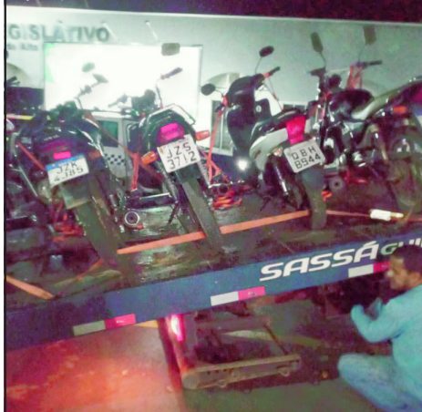
Motos entre a maioria dos veículos apreendidos