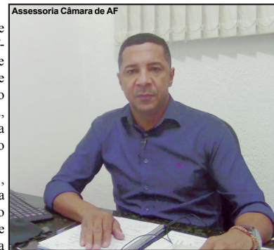
Vereador faz cobranças à concessionária

Desde que assumiu a concessão do trecho, a Via Brasil tem sido cobrada sobre investimentos, mas em resposta, como há poucos dias, declarou em Nota à imprensa que tem prazo para apresentar estudos e anunciar obras a serem feitas. Por outro lado, quem transita na via estadual que repassou a concessão por 30 anos ao consórcio,