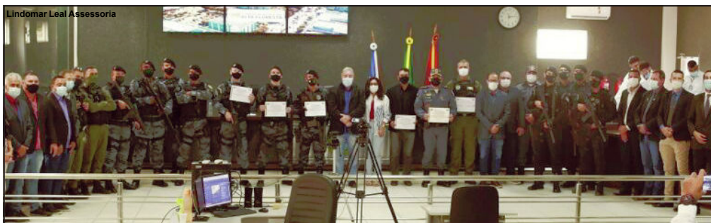
Agentes da segurança pública do estado receberam Moção na Câmara de Alta Floresta

Ao todo foram homenageados 307 policiais do 9º Comando Regional da Polícia Militar de Alta Floresta, do 3º Comando Regional da Polícia Militar de Sinop, do 8º Comando Regional da Polícia Militar de Juína, do Batalhão de Operações Especiais (BOPE), do Centro Integrado de Operações Áreas (CIOPAER), da Gerência de Operações Especiais (GOE), da Gerência de Combate ao Crime Organizado (GCCO), das Delegacias Regionais de Polícia Judiciária Civil de Alta Floresta e Juína, e das Delegacias Municipais de Polícia Judiciária Civil de