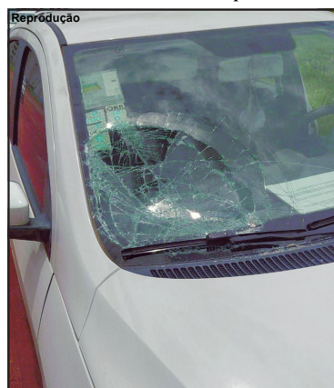
Vítima bateu com cabeça no parabrisa do carro

Carro ainda bateu em outra bicicleta, mas a segunda vítima pulou antes de ser atingida