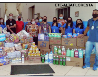
O Lar reúne cerca de 40 idosos, com faixa etária entre 60 e 93 anos, acolhidos de forma permanente e portadores das mais diferentes necessidades

“O projeto foi um sucesso, e mais que isso, um exemplo. Agradecemos imensamente a iniciativa da Seciteci [Secretaria de Estado de Ciência, Tecnologia e Inovação], em nome da Escola Técnica pela ação. Nossos idosos são pessoas que tanto fizeram e contribuíram para a sociedade, e hoje recebem esse reconhecimento dos nossos alunos. Uma ação que pode ser considerada uma aula de formação humana,