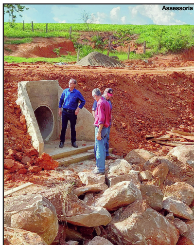
Vereador acompanhando obra em AF

"É a realização de um sonho porque há muito tempo não era feito um serviço de boa qualidade, os moradores estão muito felizes. Gostaria de agradecer a equipe do Cabelo pelo trabalho, também