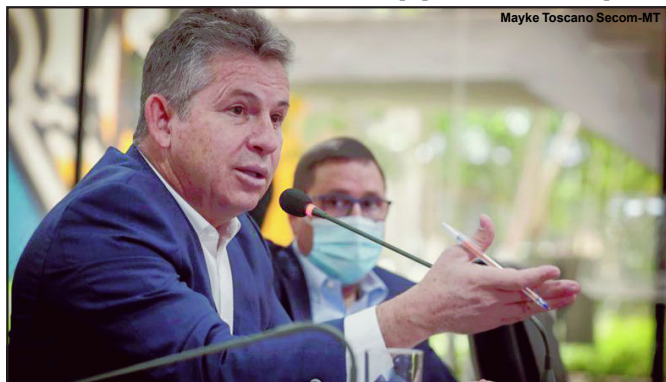
O governador Mauro Mendes diz que estado vai cobrar presidiários

O valor diário do uso da tornozeleira eletrônica será de R$ 5,70; já nos casos de Maria da Penha, o equipamento e o botão do pânico custarão R$ 11,40 por dia aos agressores