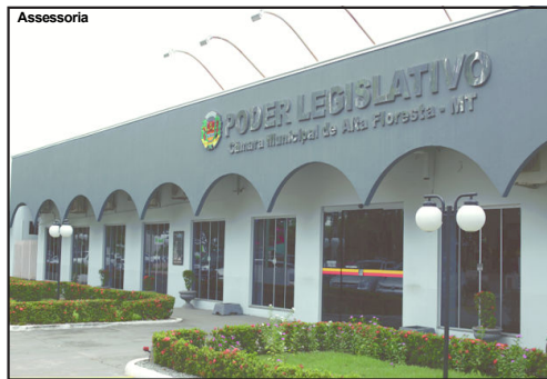
Câmara de Alta Floresta foi o centro das discussões

é um instrumento de planejamento governamental que define as diretrizes, objetivos e metas da administração pública federal para o horizonte de quatro anos.