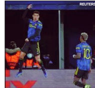
Cristiano Ronaldo abriu a vitória do United

Villarreal 0x2 M.United Young Boys 3x3 Atalanta D.Kiev 1x2 Bayern de Munique