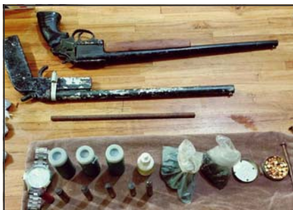
Material apreendido foi encaminhado à Delegacia de Polícia Civil

Caso em Alta Floresta foi encaminhado à Delegacia Municipal de Polícia Civil