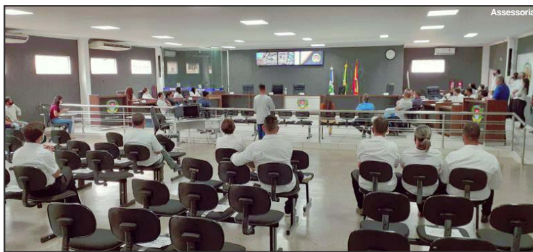
Casa de Leis apresenstou investimentos em 2021

Com página na internet – altafloresta.mt.leg.br, a Câmara Municipal de Vereadores de Alta Floresta também tem