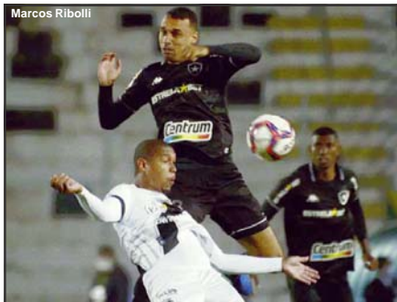
Ponte Preta 0x0 Botafogo