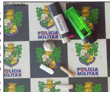
Cigarros e porção de entorpecente que estavam com alunos de escola estadual

Com os três adolescentes foram encontrados dois cigarros parcialmente ‘fumados’ e uma porção do mesmo produto. Os três adolescentes foram encaminhados à Central de Operações da Polícia Militar onde