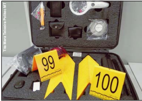
Material vai auxiliar nas investigações

A aquisição faz parte do Projeto de Fortalecimento da Rede Integrada de Banco de Perfis Genéticos (RIBPG).