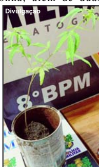
Planta de cultivo proibido também foi encontrada

No fundo do quintal da mesma casa foi encontrado um buraco contendo mais grande volume em porções de maconha.