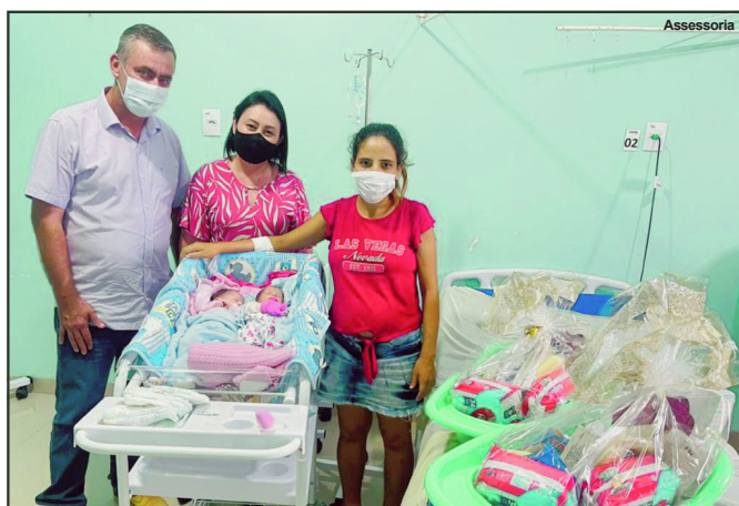
Momento de entrega no município de Apicás