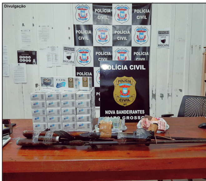
Produtos e armas apreendidas em posse dos suspeitos conduzidos

levantadas pela Polícia, o casal dono do Bar muito conhecido, recrutava garotas para o garimpo e essas quando chegavam já era com dívidas altas e “que geralmente tinham dificuldade para pagar”, comentou uma fonte, alegando que as mulheres eram submetidas à prática de relação sexual com os clientes do estabelecimento “mas o dinheiro ia para a mão dos donos do lugar. Elas não conseguiam pagar essas dívidas e ali, quando queriam sair, recebiam ameaças, até mesmo com uso de arma de fogo”, acrescentou a fonte da Polícia Civil. Dezenove agentes de segurança