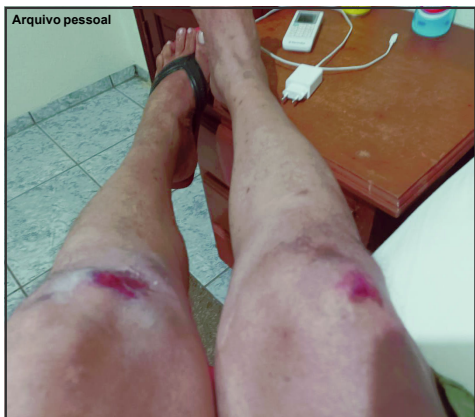
Motoqueiro diz que foi atropelado e sofreu escoriações

Os dois condutores deverão prestar depoimento e a Polícia Civil investigar o fato