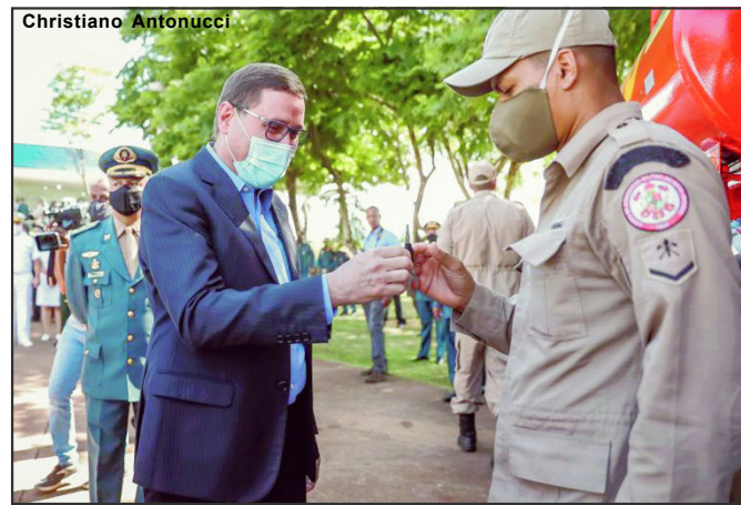
Governo do Estado entrega 17 novas viaturas para o Corpo de Bombeiros de MT

“É um orgulho muito grande estarmos aqui para realizar essas entregas e comemorar as promoções por merecimento, dedicação e comprometimento desses militares com nosso Estado de Mato Grosso. Estamos realizados a entrega dessas 17 viaturas, que fazem parte do programa Mais MT, para fortalecer o trabalho dos bombeiros nos atendimentos das diversas