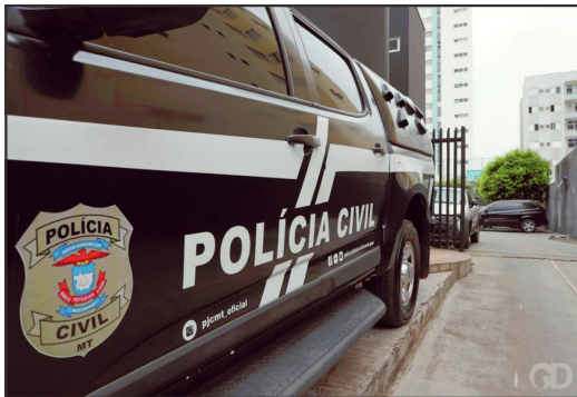
Caso investigado pela Polícia Civil foi registrado no Morada do Ouro