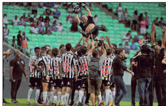
Jogadores comemoram título com técnico Cuca

foi extravasado durante toda uma noite pela massa atleticana e pelos jogadores que comemoram nos braços da torcida o título de Campeão Brasileiro de 2021.