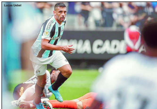
Grêmio tentará escapar da Série B