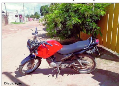
Infratores pintaram motocicleta de outra cor, mas veículo foi reconhecido

Um dos infratores é irmão de um jovem ex-presidiário executado há pouco tempo