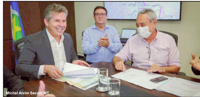
Governador assume compromisso para mais asfalto em AF