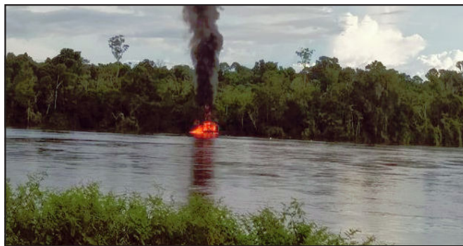
Garimpeiros, de longe, registraram balsa pegando fogo no Rio Teles Pires

De acordo com Winter, cada balsa atua com pelo menos quatro a cinco garimpeiros e muitas delas com uma cozinheira. “São aproximadamente 100 famílias prejudicadas. A maioria dessas pessoas vai ficar desempregada devido a uma ação onde agentes federais tratam os trabalhadores como bandidos. Agora, nunca vimos polícia