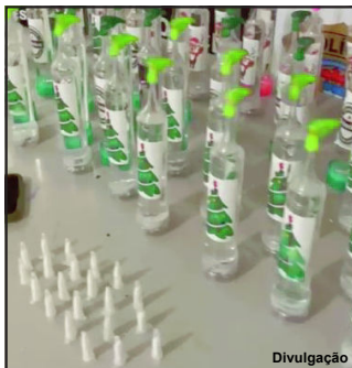
Lança-perfume chegou pelos correios e cocaína estava em hotel