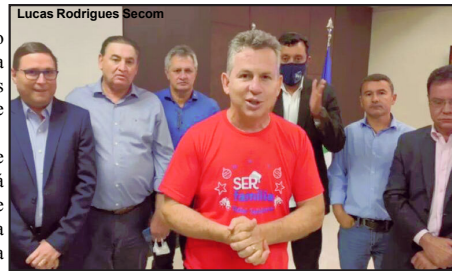
Mauro Mendes resolve aumentar um pouco o RGA dos servidores

Assembleia Legislativa aprovar a mudança e, após, a lei seguir para sanção do governador. Vencidas estas etapas, em janeiro de 2022 os servidores públicos estaduais já receberão o reajuste de 7% sobre os vencimentos.