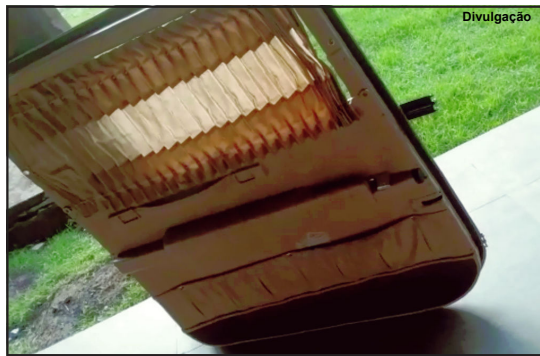
Porta da aeronave foi resgatada por mergulhadores

Aeronave caiu na segunda-feira à tarde quando se preparava para pousar