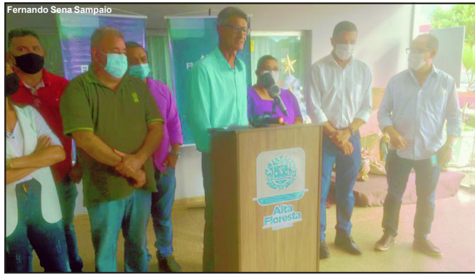
Prefeito anunciou economia de quase seis milhões na Educação

Câmara deverá autorizar o executivo que em ano de Pandemia, acabou economizando