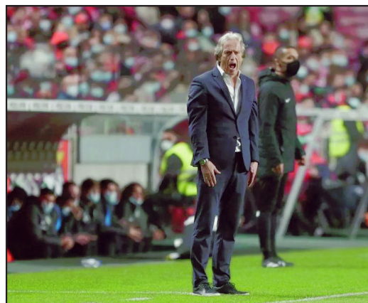
Jorge Jesus em derrota do Benfica para o Sporting no derby lisboeta