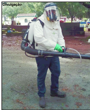
Nebulizadores devem intensificar ações contra dengue em AF

tarefa que a prefeitura através da Secretaria de Saúde e em parceria com a Secretaria de Infraestrutura tem feito, haverá um investimento ainda de quase R$ 27 mil na aquisição de nebulizadores motorizados para borrifar os locais mais afetados pelo vírus ou onde forem encontrados mais focos do mosquito transmissor da dengue.