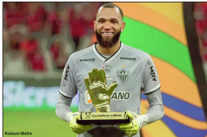
Everson renovou contrato com o Galo

O Cruzeiro teve suas ações da SAF vendidas para Ronaldo Fenômeno no último final de semana e uma decisão importante já foi tomada nesta terça.