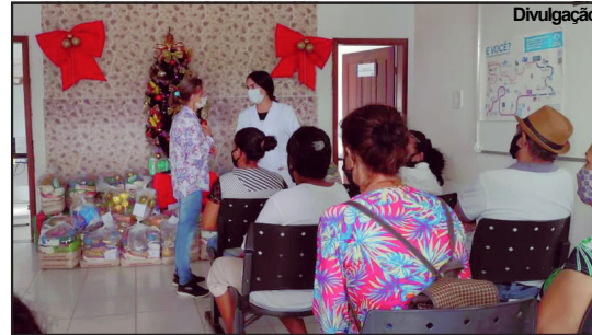
Famílias acolhidas pelo PSF foram selecionadas para receberem as cestas

Ideia de uma enfermeira foi abraçada pela equipe e colaboradores